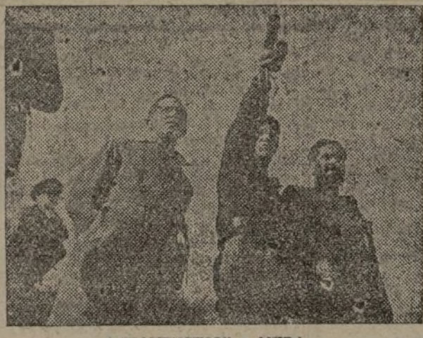
"CAMPESIÑO" y MER/