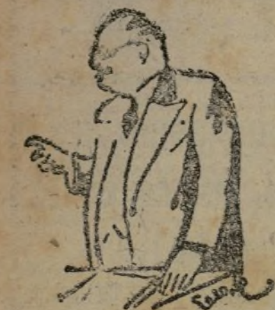
Litvinov, comisario del Pueblo de Negocios Extranjeros

Moscú, 18.—Los embajadores de la U. R. S. S. en París, Londres, Washington, Varsovia y otras capitales, han hecho entrega a los respectivos Gobiernos de la declaración de Litvinov relativa a la necesidad de convocar una Conferencia Internacional contra los actos de agresión.—Fabra.