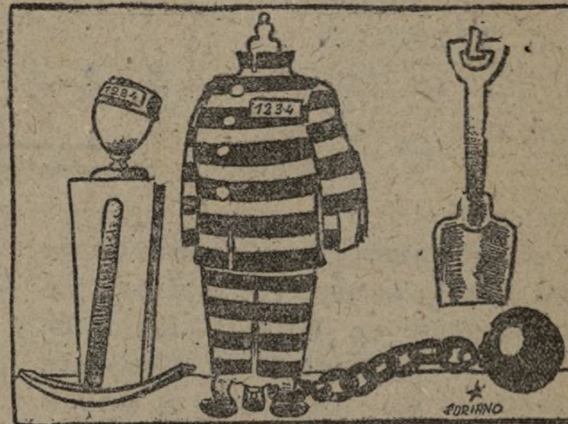
Traje para especuladores, emboscados, derroteristas, saboteadores y demás personajes de la «quinta columna».