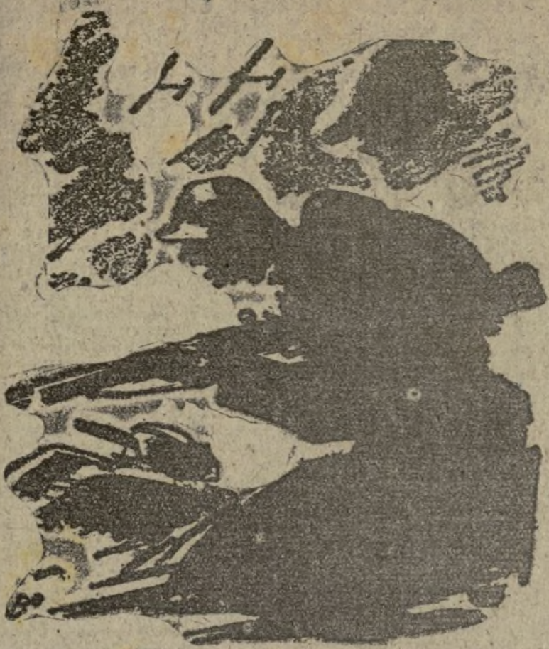
¡La Patria pide a sus hijos un gran esfuerzo: ¡Resistir ahora, atacar y vencer pronto!