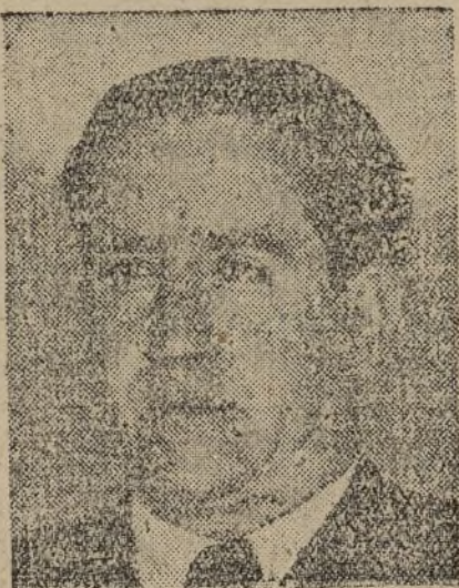
—¿Si. Nuestro Comité Central tiene una Delegación en esta zona, de la cual forma parte, en unión de los camaradas Chera, Gloria y otros, para estar en contacto con nuestro Partido y con las masas para todo el trabajo en esta parte.

—Desde luego, los enemigos, los elementos de la quinta columna, trabajan y se mueven. Pretenden crear dificultades con el propósito de llevar el malestar al pueblo. Hubrá que estar muy vigilante para impedir sublevarse, cualquier de rumores, fomento y desarrollo de la especulación, porque seguramente intentarán por esta criminal manera socavar la obra del Gobierno y sembrar el desaliento entre los masas. Aquí tiene, precisamente, el Frente Popular una gran tarea en la lucha contra la quinta columna, desmoralizando a sus agentes y contrarrestando eficazmente su obra de provocación.