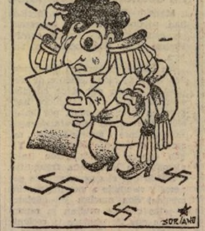
FRANCO (leyendo la declaración de principios de nuestro Gobierno).—(Este me trae la negra).

(Leído ayer por Unión Radio Valencia en la emisión especial de VERDAD)