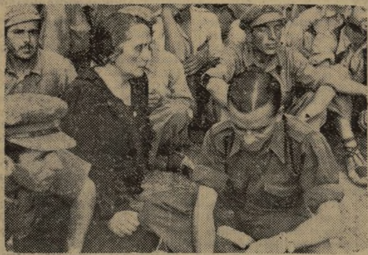
PASIONARIA Y ANTON, DESPUES DE LAS ULTIMAS OPERACIONES DEL SECTOR CENTRO, CONVERSAN CON LOS BRAVOS COMBATIENTES DE LA REPUBLICA