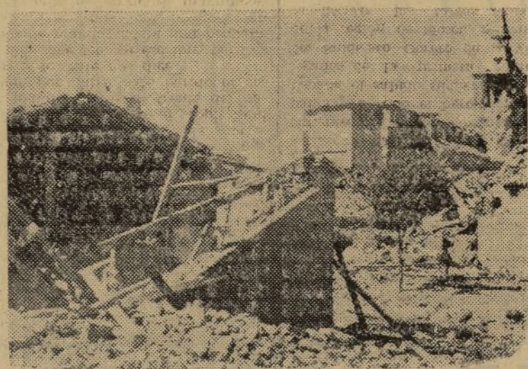
EL PUEBLO PRESENTA PROFUNDAS HERIDAS QUE LE HARAN INMORTAL EN LA HISTORIA

La experiencia de este contraataque enemigo ha sido saludable. Nos ha enseñado muchas cosas. Entre ellas, que las fuerzas fascistas carecen ya de acometividad. De noche no pueden luchar en absoluto,