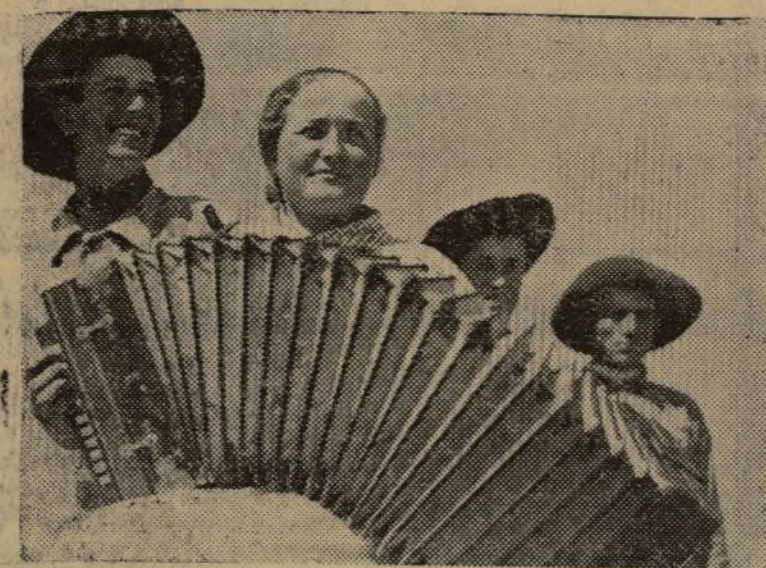
EN LA UNION SOVIETICA. — DESCANSO FELIZ