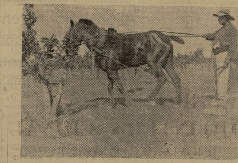
EL "ENTAUILLAT" ES UNA FAENA MUY NECESARIA AL NARANJO. ESTE CAMARADA LA REALIZA EN UN HUERTO, QUE AUN HA DE TARDAR EN DAR FRUTO

Todo valenciano sabe muy bien la importancia que encierra la cosecha de la naranja. De todas las riquezas de Levante, esta es la más completa, la que saliendo por los caminos del mar devuelve en raudales de oro efectivo sus hebras de oro.