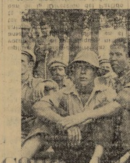
LOS SOLDADOS DEL EJERCITO DEL PUEBLO SE TOMAN UN MERCEDOSO DESCANSO DESPUES DE LAS DURS JORNADAS DE OFENSIVA.

Ahora volvían, nuevamente rele- vados, a través del llano, a pleno sol de mediodía, los hombres de nuestras brigadas móviles. Hace ya meses que estas brigadas pidieron para sí los puestos de mayor peligro.