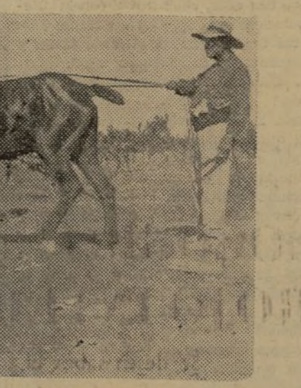
EL "ENTAUILLAT" ES UNA FAENA MUY NECESARIA AL NARANJO. ESTE CAMARADA LA REALIZA EN UN HUERTO, QUE AUN HA DE TARDAR EN DAR FRUTO

Sin duda alguna en los momentos actuales, más que en ningún otro