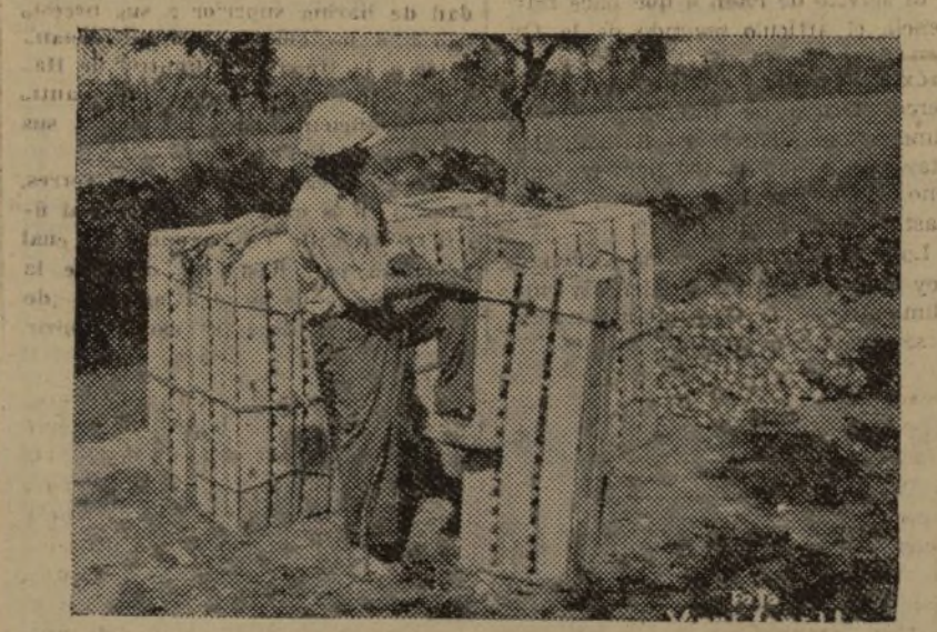
LAS CEBOLLAS QUEDAN EMBALADAS EN EL MISMO CAMPO PARA SER ENVIADAS AL EXTRANJERO