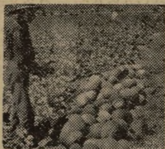
ESTE CAMPESINO AMONTONA EL FRUTO PARA LLEVARLO A LA SOCIEDAD

Una de las mayores plagas del campo era la de los "comerciantes", que en las proximidades de la recolección de cada producto se acercaban por el pueblo y establecían una competencia que sólo a ellos beneficiaba.