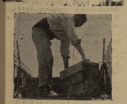
DESCARGANDO UN CARRO DE TOMATES

Cuando llegó la guerra, por los campos de Valencia y sobre el fruto del trabajo honrado, se extendió la incompreensión como una grave amenaza. El campesino miraba la tierra de sus amores medroso de lo que le pudiera acontecer y la seguía cuidando.