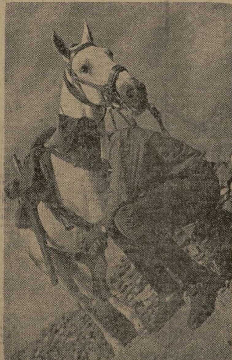
LA CABALLERIA REPUBLICANA PRESTA MAGNIFICOS SERVICIOS A LA CAUSA DEL PUEBLO. HE AQUI UN SOLDADO DE ESTE GLORIOSO CUERPO EN UN MOMENTO DE DESCANSO

Viena.—Esta mañana ha llegado a esta capital el comisario de Negocios Extranjeros de la U. R. S. S., camarada Litvinoff. Se aloja en la Legación soviética. —Fabra.