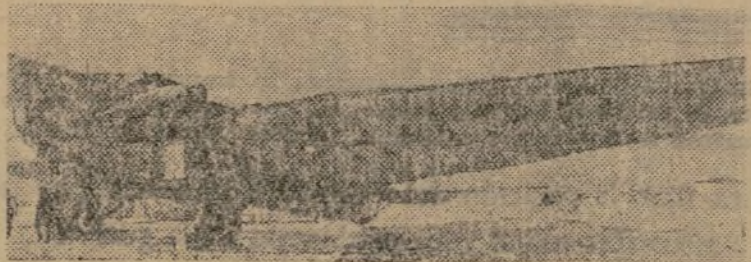
¡AL SERVICIO DE LA HUMANIDAD! HE AQUÍ UNO DE LOS POTENTES AVIONES, CONSTRUIDOS EN EL PAÍS DEL SOCIALISMO, QUE HICIERON EL VUELO MOSCÚ-POLO NOROCCIDENTAL.