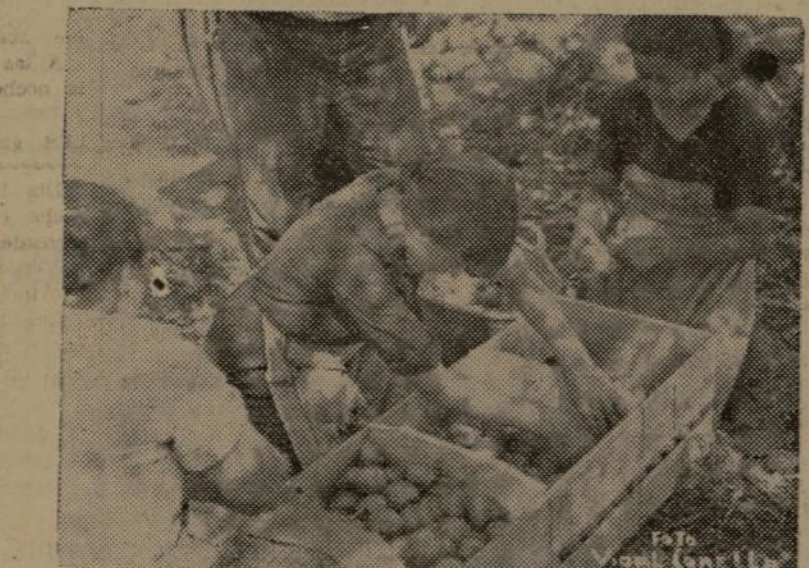
LAS MUJERES CONTRIBUYEN A LAS LABORES DEL CAMPO. ESTAS CAMPESINAS DE ALBUXICH SON UNAS EXPERTAS EN BALADORAS DE CEBOLLA