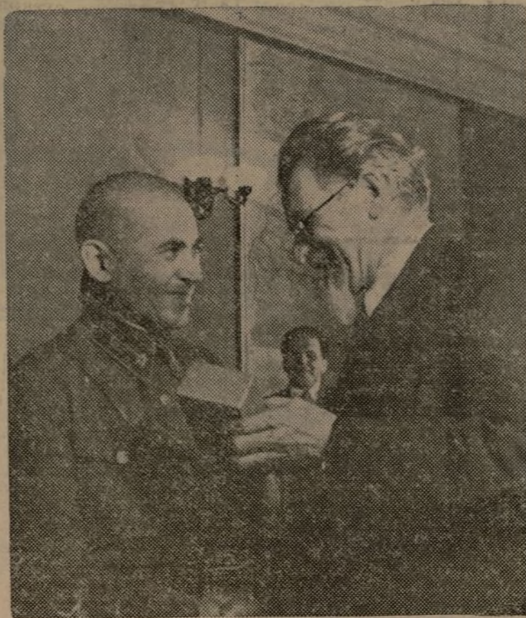
EL PRESIDENTE DE LA REPUBLICA, KALININ, CONDECORA AL COMISARIO DEL PUEBLO DE ASUNTOS INTERIORES Y COMISARIO GENERAL DE LA SEGURIDAD DEL ESTADO, CAMARADA M. I. YESHOV, CON LA ORDEN DE LENIN.