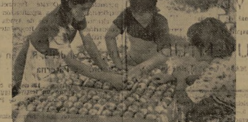
TRES BUENAS EMBALADORAS DE FRUTO

—Desde luego. Si no hubiera guerra ya tendríamos que estar contentas.