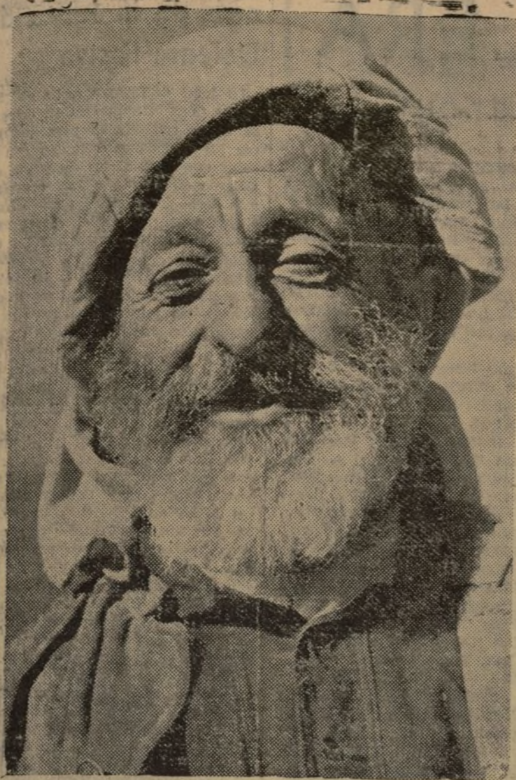
CAMPESINO KOLJOSIANO QUE EN LA GEORGIA SOVIETICA VIVE FELIZ TRABAJANDO LA TIERRA SOCIALISTA

ana N O na del un gol do por con la teos, d posición a la co Malpica y, la de tr cular guarda orte de ezas, el ametr ca del le ocho se re pueblo o la stas que nas se tro en asas Pelip ay, la er hom la pa sus ha ghal el al la pa d im organi o a re guente tipos do má do que la re de la de la se, en 37, por e, pue e, grave los de desma ulo. Ch fascis os, mu contra reñun ciones de la realidad oloz, p e divide territ es, pue dinal d comenz es am e sea s par, p as ar realid a, he práct su la técnica realid os gen los G y de b Lavin n inte nente la p de la recor todas orque ados a