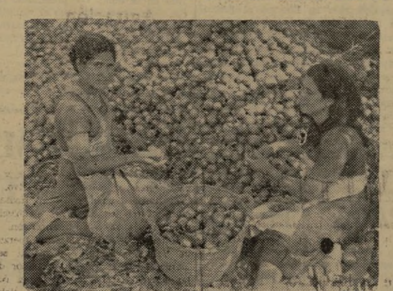
ESTAS DOS COMPAÑERAS ESCOGEN CUIDADOSAMENTE LA CEBOLLA

—¿Yo? De la U. G. T. —¿Trabajáis todas a la U. G. T.?