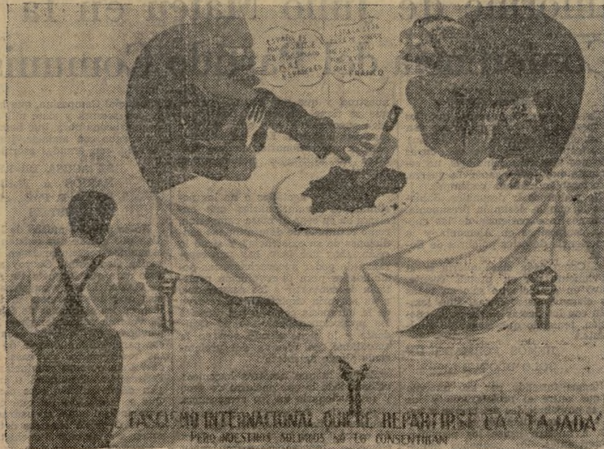
COMO TRABAJAN LOS CAMARADAS DEL TALLER DE MILICIAS, PARA DECORAR LOS "HOGARES DEL SOLDADO"

J. M. V. Se cree inminente una ofensiva general china contra Hong Kuei-Fabr