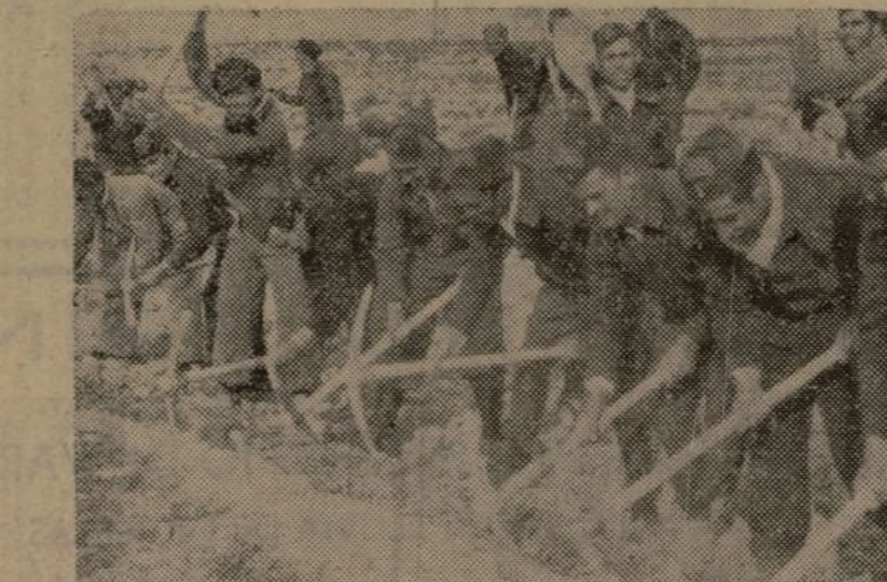
UNO DE LOS BATALLONES DE FORTIFICACION QUE ASEGURAN LOS TERRENOS ULTIMAMENTE CONQUISTADOS POR NUESTRAS TROPAS. — (Foto Mayo)

Moscú.—En el concurso de modelos de aviones celebrado en Koktebel, un nuevo modelo con motor de coacción ha establecido un nuevo record soviético, manteniéndose en el aire 29 minutos, 44 segundos y recorriendo en ese tiempo nueve kilómetros.—A. I. M. A.