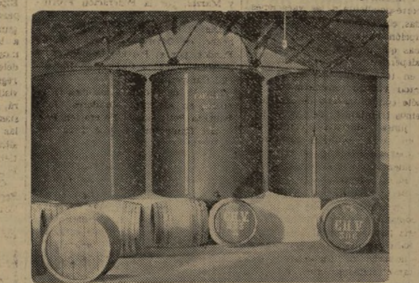
UNA NAVE DE LA COOPERATIVA "CHESTE VINICOLA" SOBRE CUYA ENTIDAD PUBLICAREMOS MAÑANA UN REPORTAJE

Por todo lo expuesto, creo que no hay punto de discusión para ir a una inmediata unificación, y pido de una vez a los dirigentes de ambas partes, que de una vez se lleven los trabajos concretos para la unificación, y así demostraremos con hechos que luchamos por el bien del proletariado y de la unidad sindical.