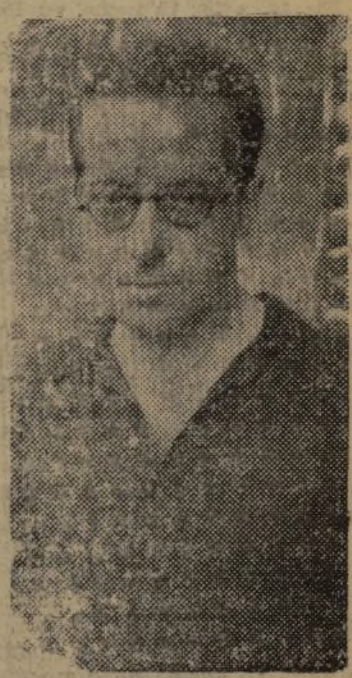
EL NUEVO GOBERNADOR GENERAL DE ARAGON, COMPANERO JOSE IGNACIO MANTECON

Después, antes o al mismo tiempo pasaban las milicias de tal o cual columna, y en frecuentes actos públicos, en los que brillaban sobre todo las pistolas y aun se veía mover en abanico las ametralladoras, se expresaba