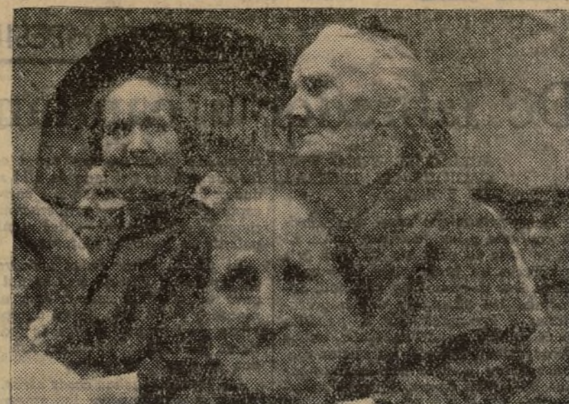
LAS MUJERES DE ARAGON ESCUCHAN LAS PALABRAS DE NUESTROS CAMARADAS

la caballería y se los dejó las manos para que trabajaran la tierra, y los comercios cerrados para comprar en ellos los géneros que no había con su dinero que les habían robado. En el mismo pueblo había un comerciante; en la campaña para las elecciones del Frente Popular se ha-