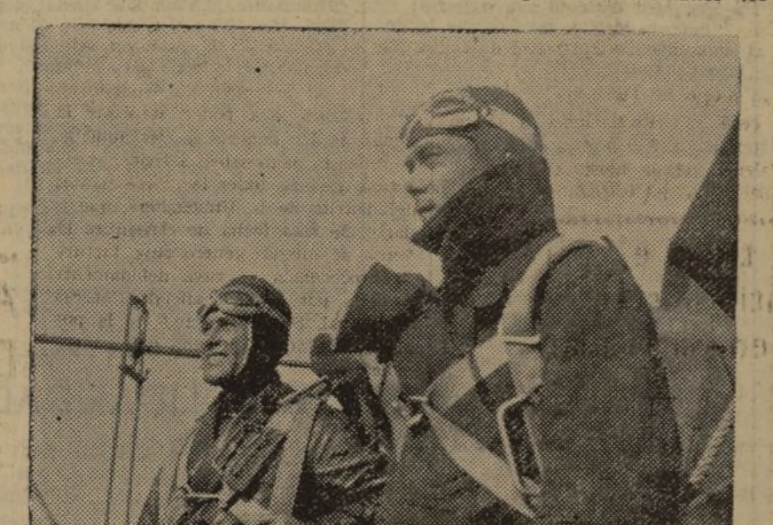
LOS HOMBRES QUE COMPONEN NUESTRA GLORIOSA AVIACION NO SON "EXTRANJEROS A SUELO. SON HIJOS DEL PUEBLO Y UNA BUENA PARTE DE ELLOS. CAMPESINOS, COMO QUEVA DE, MOSTRANDO EN LA INFORMACION QUE ILUSTRAR ESTA FOTO

Los jóvenes pilotos se cuadraron ante él y cumplieron sus órdenes. Ha volado en el Sur, y sobre los tejados de Zaragoza, y a pocos metros de las torres de Huesca. Este muchacho, antes que mecánico de aviación, fue labrador en sus tierras arriales de Toledo. Acaso — sin acaso — pasó hambre. Era un muchacho triste que huía de los campos de labor, de los cañiques, de la cárcel siempre abierta y de la miseria. DESDE SU AVION HA VISTO LA TIERRA IN-VIDADA, SIN CULTIVAR Su historia de guerra es edificante. Voló en aquellos aparatos de los primeros días, que sólo tenían una misión concreta que cumplir: derribar al enemigo por los "Junkers". El cuenta muy expresivamente la llegada de los primeros aviones de bombardeo, duros y veloces. El subió en uno y probó la victoria de los kilómetros por hora y a cargo considerable de bombas. Con estos aparatos evolucionó por los objetivos militares de Huesca y vio cómo una cortina de humo — humo nacido bajo sus alas — envolvía la ciudad a punto de ser reconquistada. Desde su fuerte avión ha visto los campos de la España invadida; campos, sin cultivo, sin hombres y sin