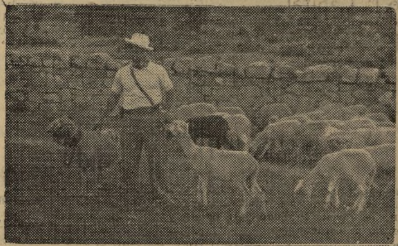
RESES AMERICANAS, PROCEDENTES DE LOS FRENTES EXTERIORES

Con el nombre de "explotación ganadera", la Dirección general de Ganadería ha establecido una Granja Pecuaria en las fincas denominadas "El Castañar", "El Sotillo" y "El Robledo de Montalbán", fincas todas ellas situadas en la provincia de Toledo.