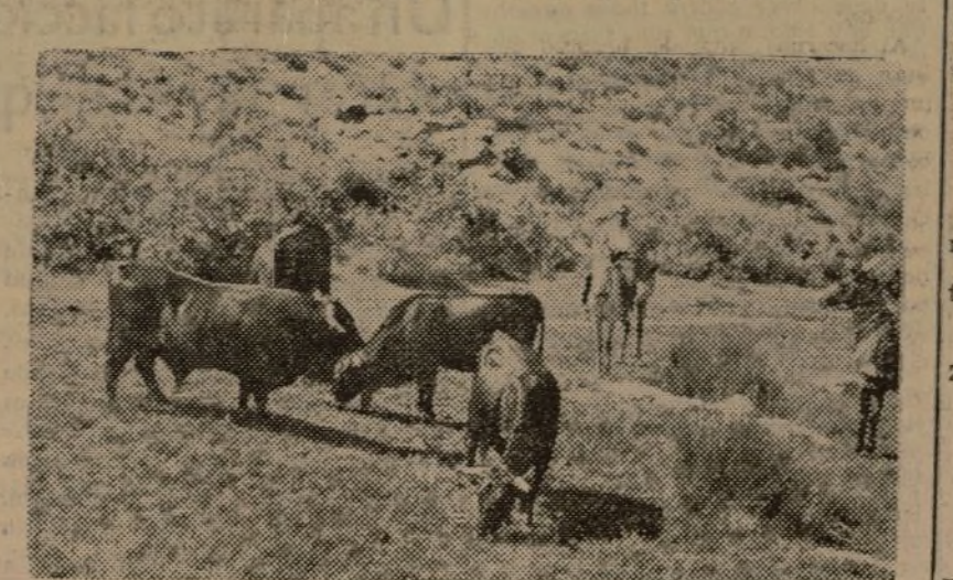
RESES VACUNAS PARA EXPLOTACION DE CARNE