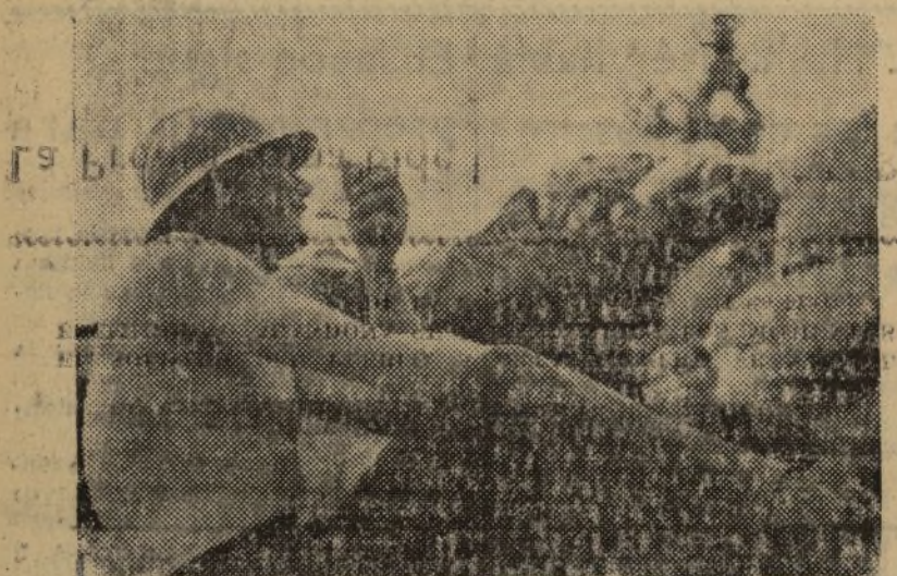
EL SOLDADO DEL PUEBLO. ALERTA SIEMPRE FRENTE AL ENEMIGO. NO ABANDONA SU PUESTO NI EN LOS MOMENTOS DE LA COMIDA

del Comité encargado por el citado decreto de continuar su actuación en Cataluña, por el Gobierno de la República se ha nombrado una Comisión que se trasladará rápidamente a Valencia, en donde se entrevistará con el ministro de Defensa Nacional y el subsecretario del Ejército de Tierra. Con motivo del acto que el Comité organiza en Lérida el próximo domingo, el Presidente de la Generalidad, se trasladará a Lérida y presidirá los actos que se celebren.