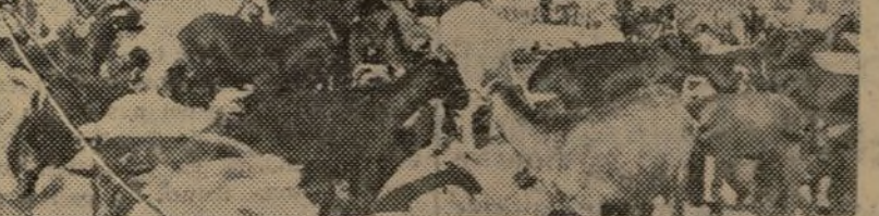
GANADO CABRIO QUE SE EXPLOTA EN PLAN EXTENSIVO Y QUE SE ENCUENTRA EN LA FINCA "EL ROBLEDO DE MONTALBÁN"

En ganado lanar, la cifra es de ocho mil novecientos veintiséis cabezas, de las que cinco mil ochocientos ochenta y siete son raza manchega, de las que se piensa obtener carne, lana, queso y estiércol. El resto es ganado merino, cuyas normas son las mismas que el ganado manchego.