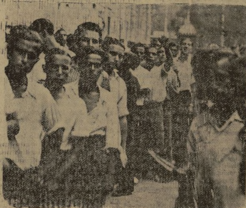
LA JUVENTUD ESPAÑOLA ESTA INCORPORÁNDOSE ENTUSIASTAMENTE A FILAS PARA LUCHAR CONTRA LOS INVASORES

He aquí una tarea fundamental e inmediata, de la que cabe esperar buenos frutos al ser emprendida con entusiasmo por los obreros de ambos partidos.