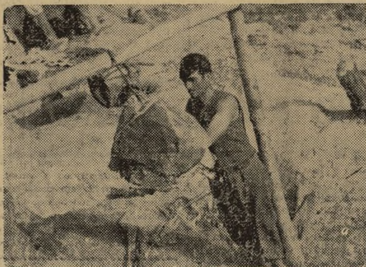
LOS SOLDADOS DEL EJERCITO POPULAR ESTAN BIEN ATENDIDOS. LA INTENDENCIA DEL PUEBLO NO DA TRATO DE FAVOR A LOS JEFES, SI HAY CARNE, ES PARA TODOS

Redacción: Guerrillero Romeu, 20 - Teléfono 11.037 — Valencia 20 de agosto de 1937 Administración: Trinquete de Caballeros, 14, bajo.—Teléfono, 17400 NÚMERO SUELTO 15 CÉNTIMOS