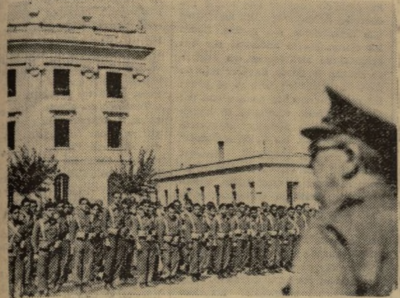
EL COMISARIO GENERAL DE GUERRA, CAMARADA ALVAREZ DEL VAYO, DIRIGIENDO LA PALABRA A LOS SOLDADOS CON MOTIVO DE LA INAUGURACION DEL HOGAR DEL COMBATIENTE (Información en la página sexta)