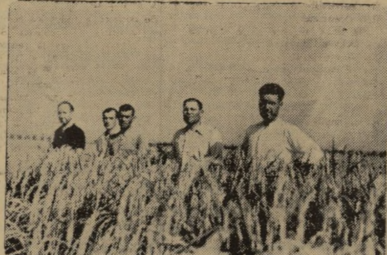
ESTA PERSPECTIVA MAGNIFICA ES LA DE LOS CAMPOS DE ARROZ DE LA COLECTIVIDAD DE CORBERA DE ALCIRA

Hemos preguntado: —¿Encontraréis dificultades en la próxima recolección?