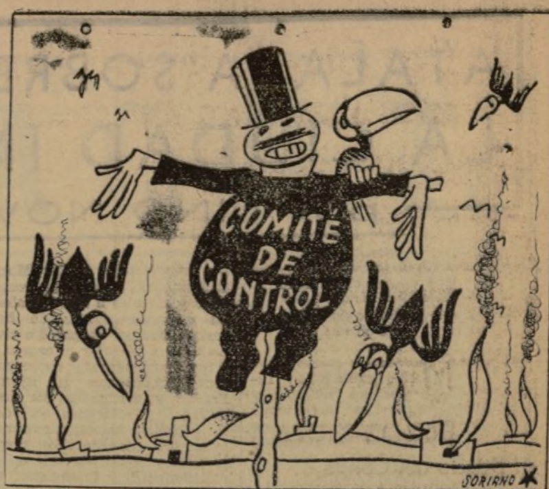
PAJARO 1.º—¿No crees que este no puede estorbar el trabajo? PAJARO 2.º—No temas; está esperando una nueva reunión.

Cte. seleccionador n. 5, del 441 al final.