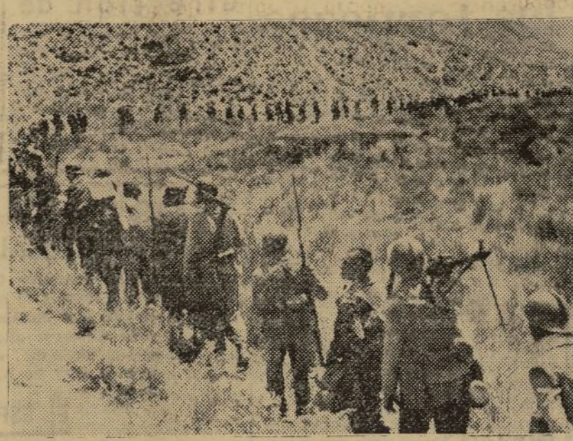
LAS TROPAS REPUBLICANAS SE DIRIGEN A OCUPAR UNA POSICIÓN

Luego se vio salir una bandada de mujeres que corría a través del campo y desaparecía en dirección a Sonseca. A la hora de escribir estas líneas no sabemos aún si esas mujeres pasaron a nuestro campo. Por