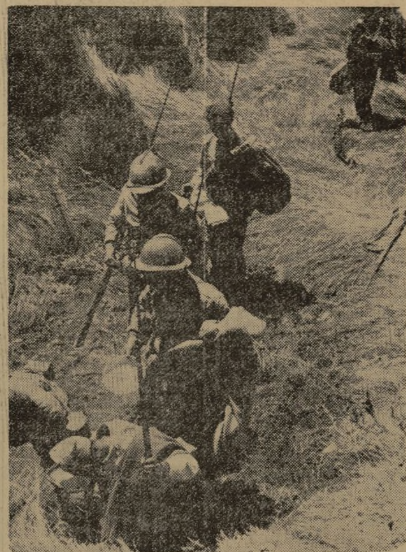
SOLDADOS DEL EJERCITO DEL PUEBLO DIRIGIENDOSE A LAS AVANZADILLAS DE UNO DE NUESTROS FRENTE

Barcelona.—La policía de S. Adell ha puesto a disposición de esta Jefatura de Policía una importante