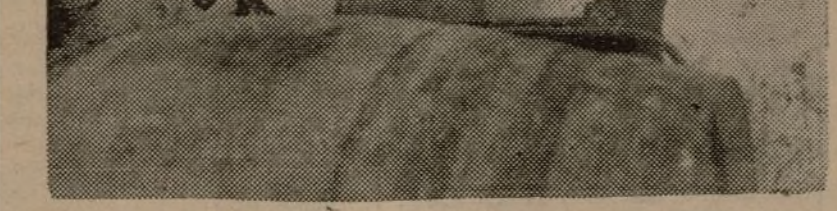
PESAJE DE LAS CUBAS QUE LLEGAN A LAS RECTIFICADORAS, POR EL QUE SE SABE LOS LITROS QUE CONTIENE