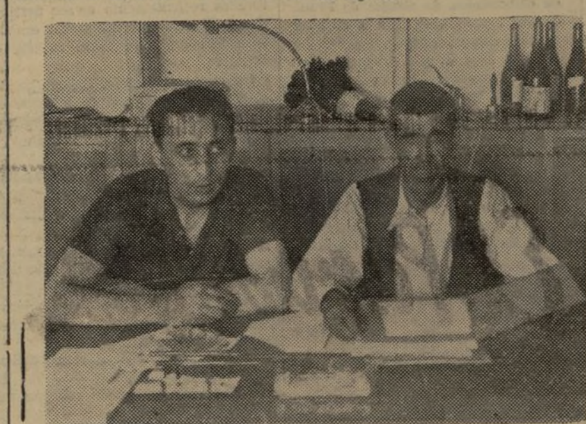
EL PRESIDENTE DEL SINDICATO AGRICOLA DE UTIEL DESPACHANDO CON EL ENCARGADO DE LA SECRETARIA

Como ya he dicho anteriormente, el Sindicato fue fundado con ciento cuarenta socios. Lo que no he dicho es que en la actualidad este número alcanza la cifra de mil trescientos.