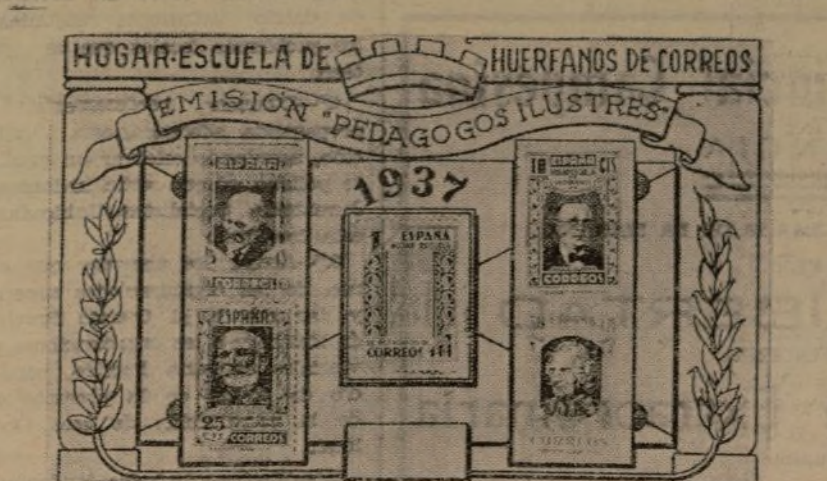
EL HOGAR ESCUELA DE HUERFANOS DE CORREOS HA PUESTO EN CIRCULACION Y VENTA UNA EMISION DE SELLOS DEDICADA A REPRODUCIR LA EFIGIE DE ALGUNOS ILUSTRES PEDAGOGOS, Y QUE GUARDA UN GRAN INTERES PARA LOS DEVOTOS DE LA FI-

Teniendo en cuenta todo esto, se comprende perfectamente por qué la presencia de los observadores extranjeros no le conviene a este pueblo que quiere revelar su secreto.