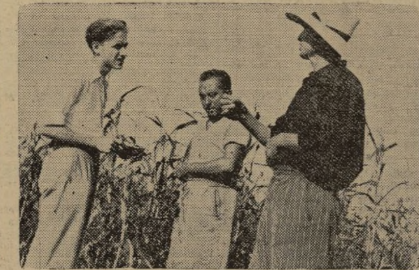
NUESTRO COLABORADOR ESCUCHA A LOS CAMPESINOS COMO SE VERIFICA LA TRANSFORMACION

EL PUEBLO Gestalar —metido entre montes— con sus casitas viejas de techumbres podridas, semeja el rincón