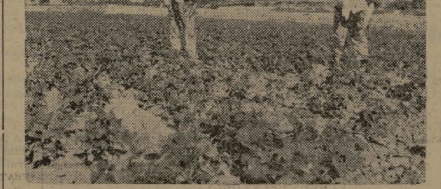
EL AGUA HA CONVERTIDO ESTOS CAMPOS EN PROMESA DE PAN SEGURO

campesinos que están a nuestro lado luchando contra el fascismo. Tampoco prospera esa otra campaña contra el Partido Comunista, tachándolo de proselitismo, al mismo tiempo que se suspende una asamblea porque es adversa la opinión de los delegados. No creemos que exista un proselitismo más automático. Pero hay que buscar la verdad de las cosas en el fondo de las mismas. El pucherazo lamentable, dado contra la voluntad de los trabajadores de la tierra, no es un hecho aislado, sino un eslabón de la cadena de arbitrariedades que están forjando el coro del personalismo. (De «Mundo Obrero»)