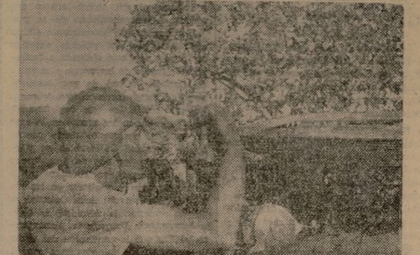
LOS TELEMETRISTAS PRESTAN UNA AYUDA EFICAZ A NUESTRA HEROICA ARTILLERÍA

Las oficinas de la Comisión Ejecutiva del Partido Socialista Obrero Español se han trasladado a la Gran Vía Du-ruti, 49, Valencia.