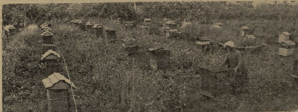
140 COLMENAS DE LA GRANJA COLECTIVA "NUEVA RUTA", DE MOSCU, QUE ESTE AÑO HAN DADO UN RENDIMIENTO EXTRAORDINARIO, GRACIAS AL BUEN TRABAJO DE LOS CAMPESINOS COLECTIVISTAS