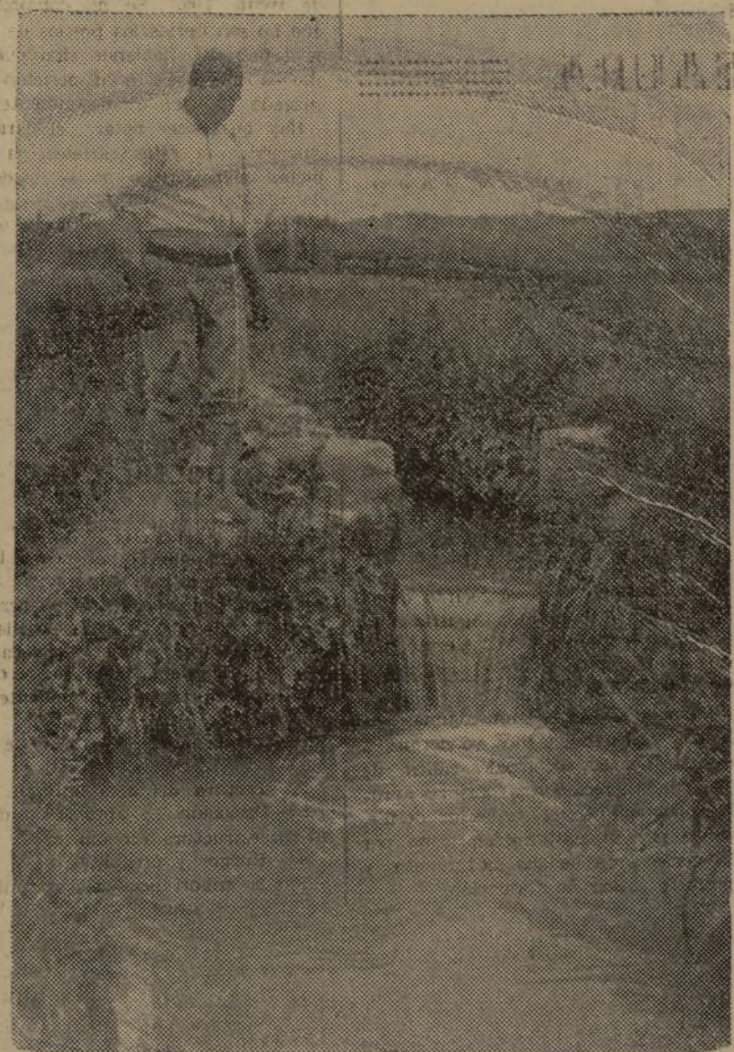
EL AGUA ES LA RIQUEZA DE LOS CAMPOS Y EL RIEGO LA MAS AGRADEBLE OCUPACION DEL CAMPESINO

La pendiente deberá coincidir en lo posible con la del terreno que tratamos de regar, para facilitar la