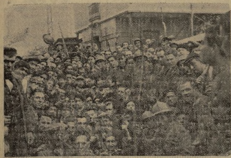
LOS SOLDADOS DEL PUEBLO FRATERNIZAN CON LOS OBREROS DE LAS BRIGADAS DE CHOQUE

Tercera época Número 36 Valencia, martes 7 septiembre de 1937