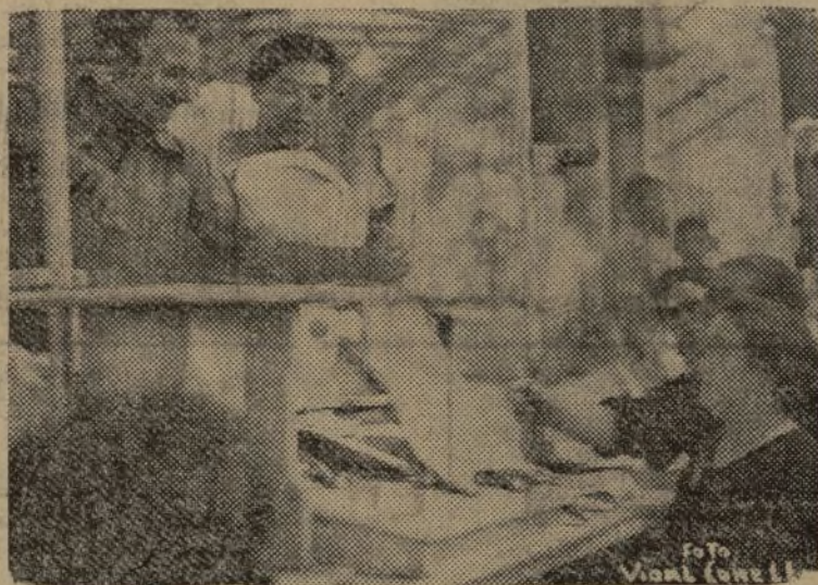
LAS AMAS DE CASA LUCHAN CON LOS COMERCIANTES DESAPRENSIVOS :: ESTAS VALENCIANAS PIDEN SE APLIQUE AL ARTICULO QUE ADQUIEREN, EL PRECIO DE TASA

MUNICIPALIZACION INMEDIATA DEL MERCADO DE ABASTOS