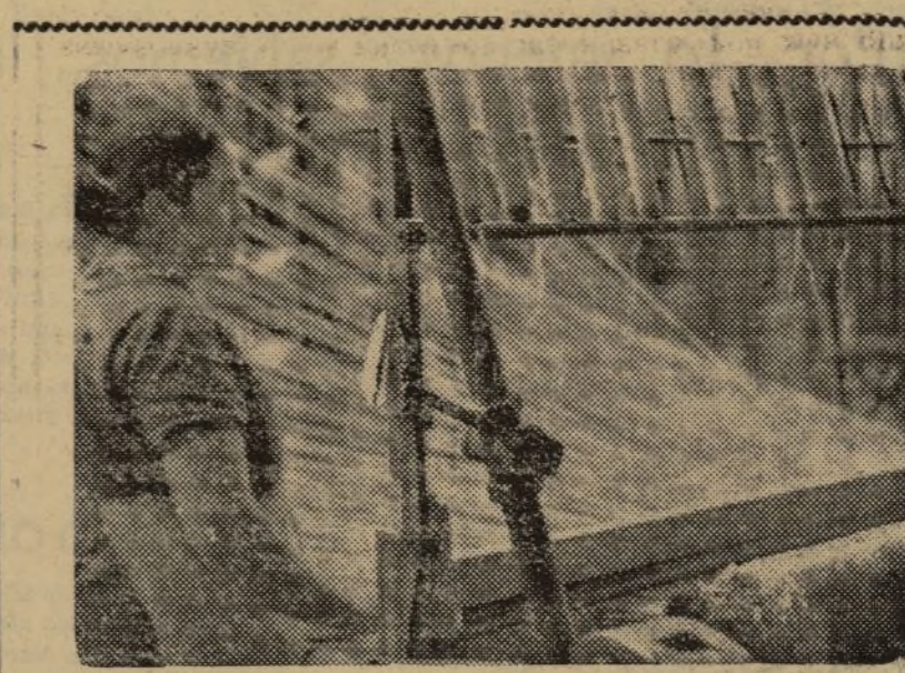
LAS MUJERES EN LA RETAGUARDIA TRABAJAN INTENSAMENTE PARA QUE NO FALTE NADA A LOS COMBATIENTES DE LA LIBERTAD

De Brouckere ha marchado con dirección a Valencia.—F. E. B.