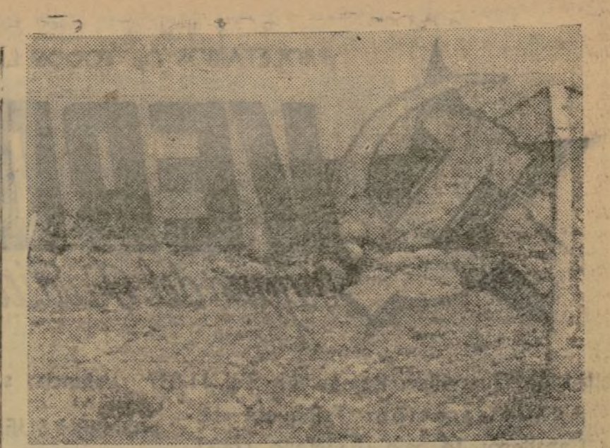
A PESAR DE LAS ALAMBRADAS Y LOS SACOS TERREROS, EL GLORIOSO EJERCITO DEL PUEBLO CONQUISTA DIA A DIA NUEVAS POSICIONES

taaviones, dispuestos, en caso de agresiones aéreas, a poner inmediatamente en acción aparatos de caza. La vigilancia se ejercerá en el Mediterráneo occidental por pilotos franceses e ingleses. Italia sería invitada, al término de la Conferencia, a asociarse a este Control en una zona determinada. En caso de no aceptarlo, los barcos de guerra franceses e ingleses ocuparían el puesto de los barcos italianos. El Control se ejercerá en el Mediterráneo oriental por barco de guerra de otras potencias del Mediterráneo especialmente de la U. R. S. S., Grecia y Turquía, con exclusión de Bulgaria y Rumania.—Fabra.