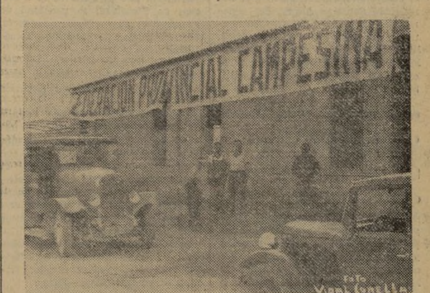
LOCALES DE LA FEDERACION, EN DONDE ESTAN INSTALADOS LOS ALMACENES

A los efectos prevenidos en el artículo quinto del Decreto del Ministerio de Agricultura, fecha 27 de agosto último ("Gaceta" del 29), se hace público que queda prohibida terminantemente la circulación por el territorio leal a la República del arroz elaborado si no va acompañado de la mercancía de la correspondiente guía expedida por la Dirección general de Abastecimientos del Ministerio de Hacienda y Economía. De conformidad con lo dispuesto en el artículo tercero del Decreto de 13 de agosto último ("Gaceta" del 14), artículo sexto de la Orden del 14 del mismo mes ("Gaceta" del 17) y Decreto fecha 27 de agosto último ("Gaceta" del 29), en el apartado d) de su artículo tercero, la falta de