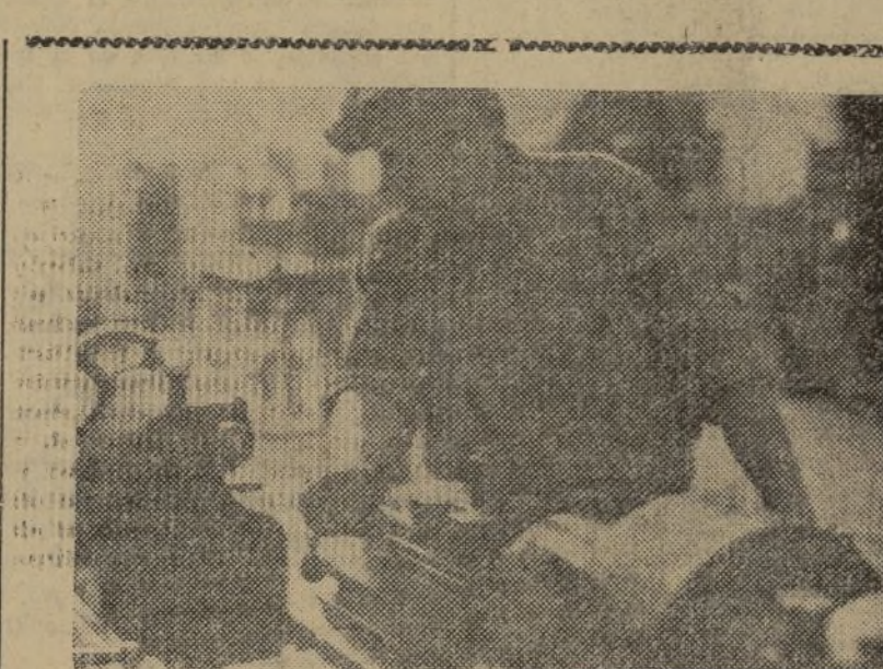
LOS OBREROS DE LA RETAGUARDIA QUIEREN SER DIGNOS DE SUS HERMANOS DEL FRENTE. EN LOS TALLERES Y FABRICAS SE TRABAJA INTENSAMENTE PARA ABASTECER A NUESTRO EJERCITO

No, amigos. Lo que queremos es los procedimientos de un hombre, por desastrosos que ellos sean. Con los que de la política de unidad an-