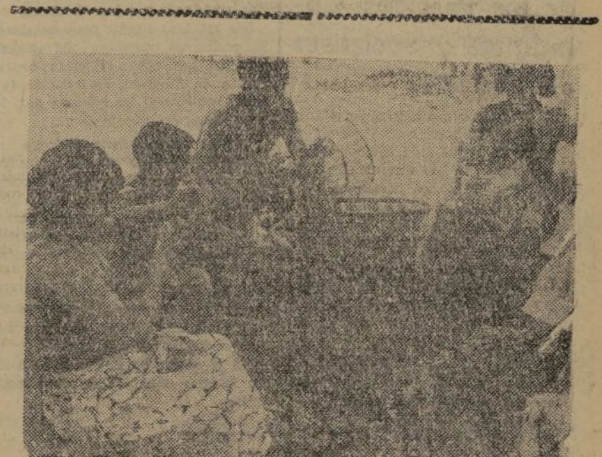
ALGUNOS MUCHACHOS COLABORAN EN LA TAREA DEL ENCASE. PERO LAS MUJERES TRABAJAN RAPIDAMENTE Y BIEN

Considera particularmente feliz el que sea precisamente en estos días cuando la Unión haga oír en Ginebra su gran voz en favor de la paz y de la justicia internacional, que es la voz de todos los pueblos que no se baten hundidos en la ignominia y en la insoportable moral y que es también la voz mayoritaria de Europa y del mundo, más fuerte y más potente que todas las habilidades de las Cancillerías.—Fabra.