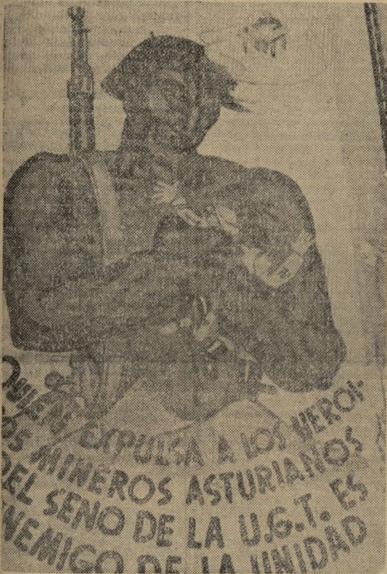
He aquí el cartel fijado en una pared de Valencia, condenando a los que han expulsado a los mineros asturianos de la Unión General

El pueblo execra a los divisionistas de la U. G. T.