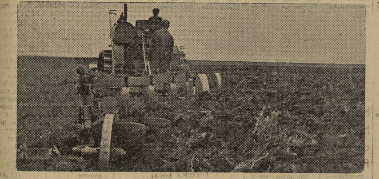
UN TRACTOR ORUGA EN UNA GRANJA COLECTIVA DE LA REPUBLICA SOVIETICA ALEMANA DEL VOLGA. A. I. M. A.