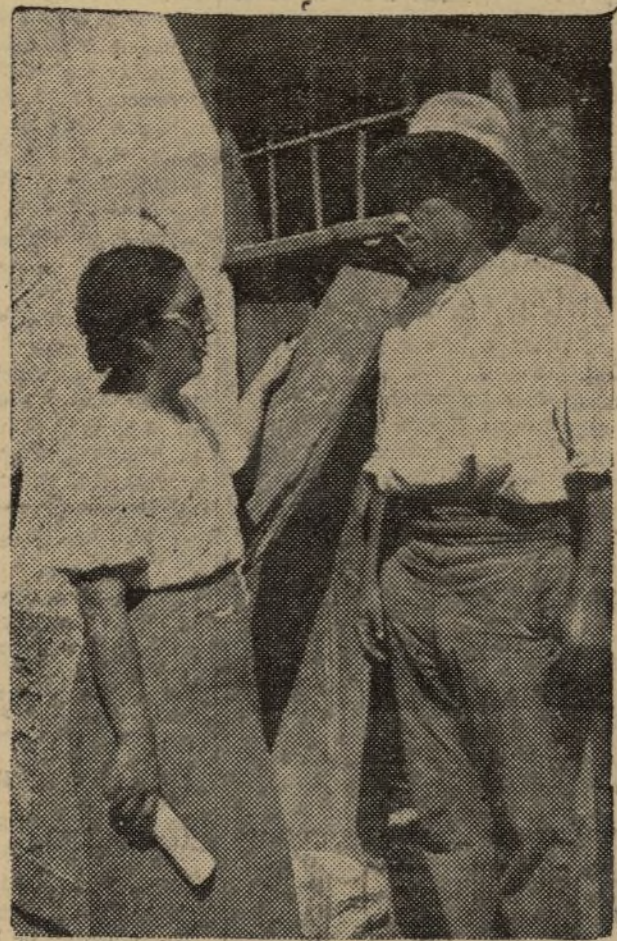
ESTE CAMPESINO DE QUINTO VUELVE DE LOS PRIMEROS, DESPUES DE LA LUCHA, PARA TRABAJAR AL LADO DE LOS SOLDADOS DEL PUEBLO