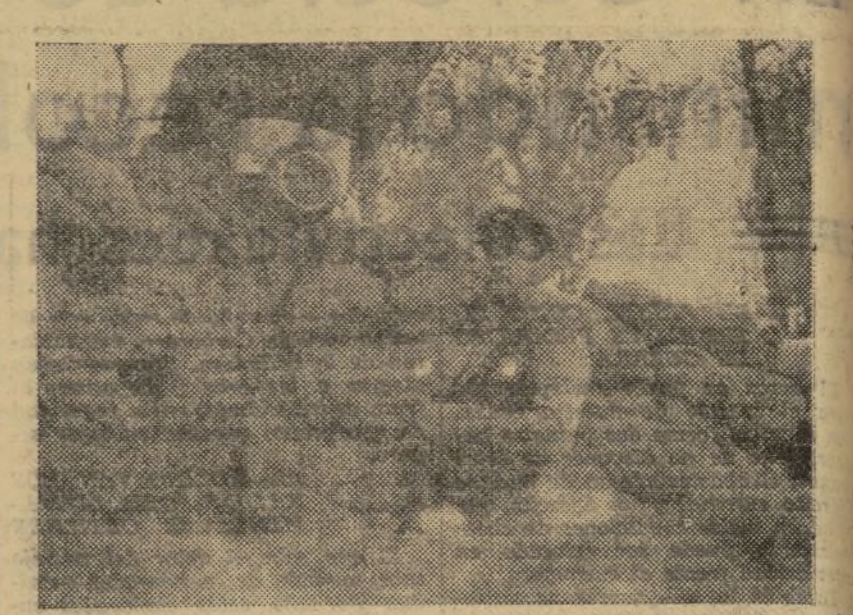
EN UNO DE LOS PARAPETOS QUE RODEAN MADRID

En los demás sectores de este puerto no hubo novedad, salvo un