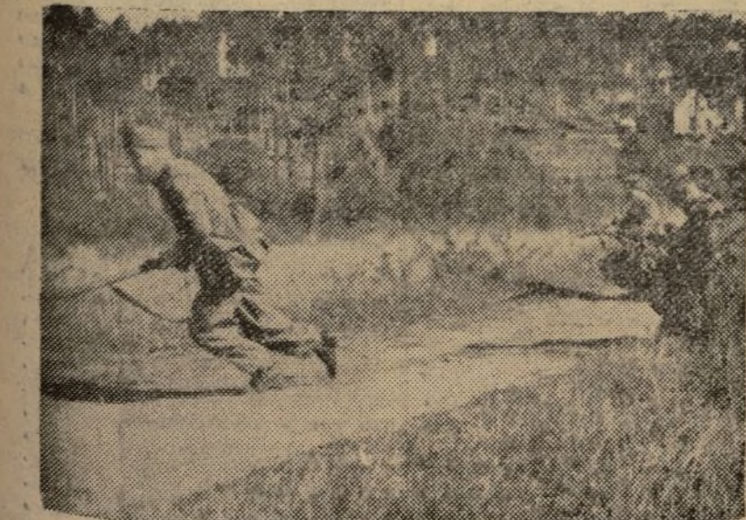
UNO DE LOS BRIOSOS ATAQUES EN QUE NUESTRO EJERCITO POPULAR SE HA CUBIERTO DE GLORIA