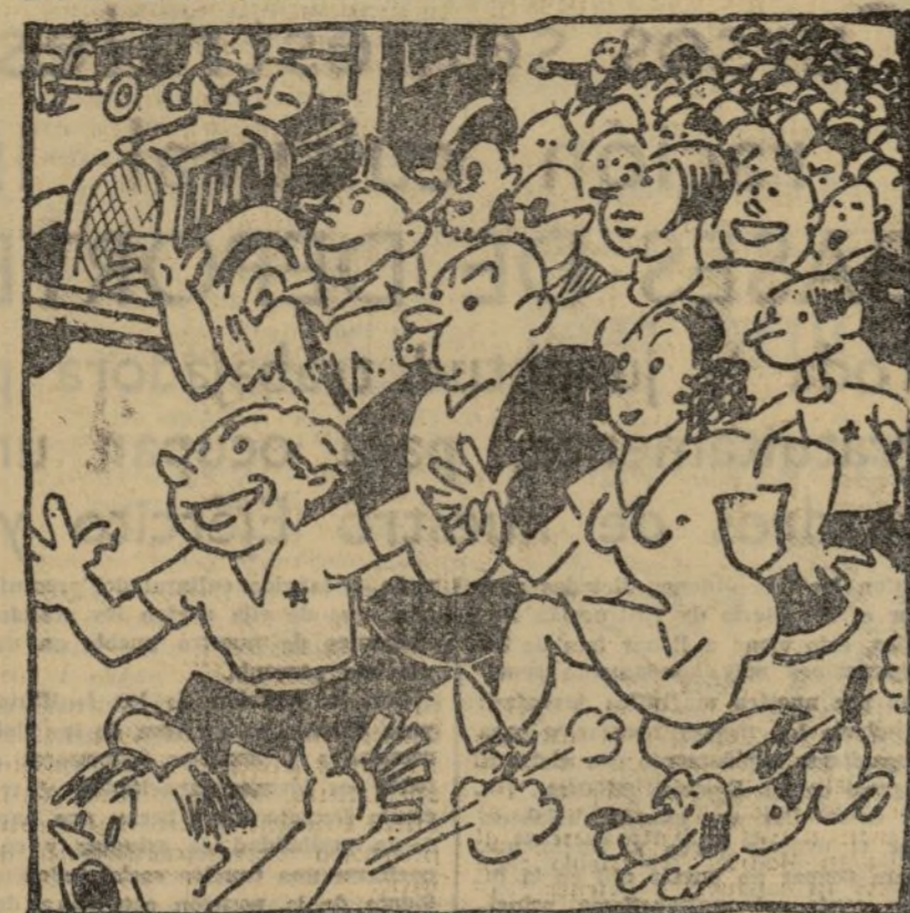
EL PUEBLO ESPAÑOL, UFANO, LIBRE YA DE LA ESCLAVITUD, IRA A VER LA EXPOSICION DE TODA LA JUVENTUD.