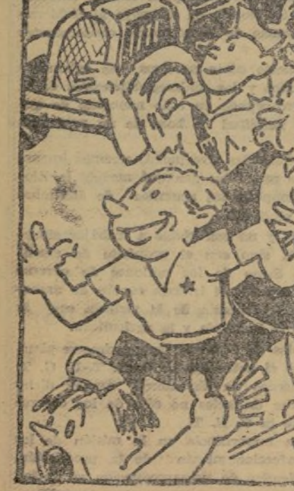
EL PUEBLO ESPAÑOL, UFANO, LIBRE YA DE LA ESCLAVITUD, IRA A VER LA EXPOSICION DE TODA LA JUVENTUD.

EN LA EXPOSICION NACIONAL DE LA JUVENTUD