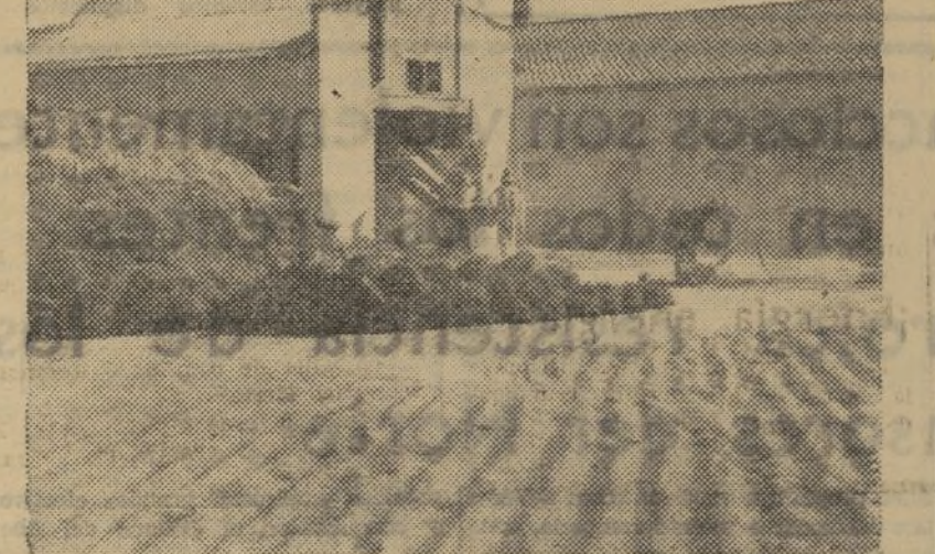
ESTA TRILLADORA DE SUECA, MANEJADA POR HOMBRES CONSIENTES DE SU DEBER, CUMPLE A MARAVILLA SU DEBER EN LA RETAGUARDIA: TRABAJA SIN DESCANSO.

—La tasa del Gobierno para los productos de primera necesidad nos ha parecido admirable. Ya debía haber llegado la hora en que se acabase de una vez con toda esa inmundicia de especuladores, agiotistas y ocultadores de víveres que empozonaban nuestra retaguardia y enquistaban al proletariado jugando con su hambre. Es necesario el máximo de energía en la aplicación del decreto. O se es fascista o se es antifascista. Quitemos ya las caretas a muchos sinvergüenzas. Un acaparador, un especulador debe ser expulsado inmediatamente de las filas del Partido o Sindicato en que milita.