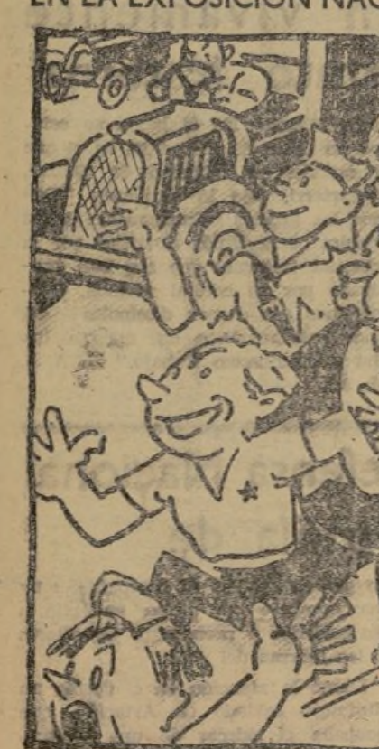
EL PUEBLO ESPAÑOL, UFANO, LIBRE YA DE LA ESCLAVITUD, IRA A VER LA EXPOSICION DE TODA LA JUVENTUD.