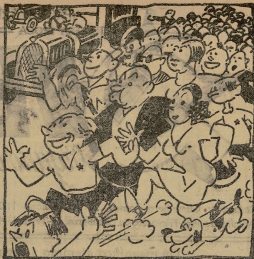
EL PUEBLO ESPAÑOL, UFANO, LIBRE YA DE LA ESCLAVITUD, IRA A VER LA EXPOSICION DE TODA LA JUVENTUD.

EN LA EXPOSICION NACIONAL DE LA JUVENTUD