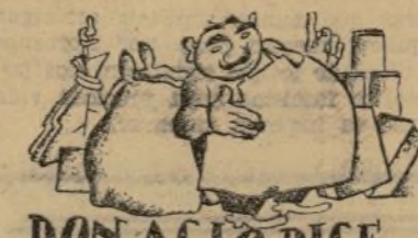
DON AGIO DICE...