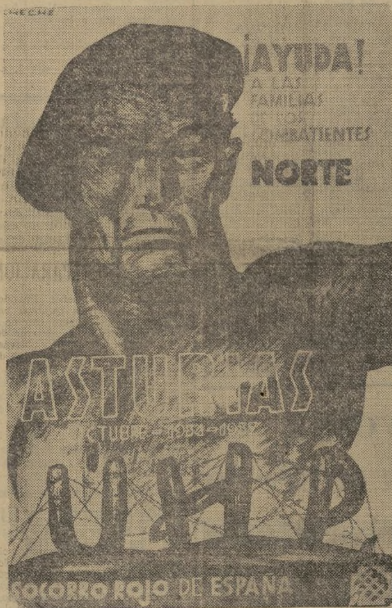
Cartel editado por el Socorro Rojo de España para conmemorar las gloriosas jornadas de octubre del 34 y la heroica defensa de octubre del 37