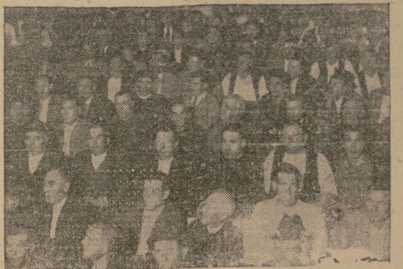
Grupo de agricultores naranjeros en la Asamblea convocada por la Federación Provincial Campesina para tratar de la producción de naranjas.

Las localidades (las pocas disponibles) podrán adquirirse de cuatro a once de la tarde, en la calle de Colón, número 11, principal.