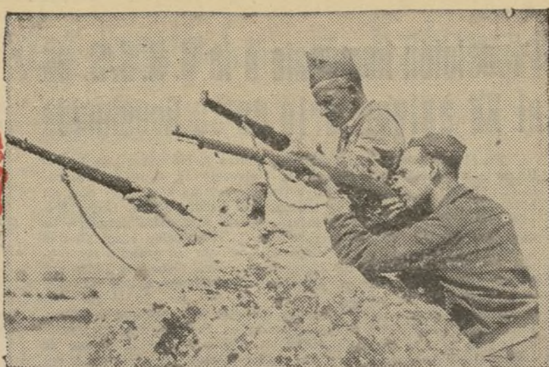
LA DEFENSA DE MADRID.—En los primeros momentos del ataque, junto a los jóvenes, los hombres de setenta años contribuían en la defensa de la ciudad victa. ¡Y no pasaron!

EL DEBER DE LOS ANTIFASCISTAS.—No, no me diga; sé dónde va... Un antifascista como usted no puede ir más que a entregar su donativo para Madrid al S. R. I.