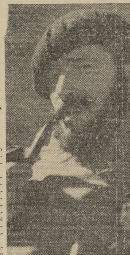
El soldado—el heroico soldado del glorioso Ejército popular—descansa, bajo el sol de otoño, de las ruidosas y fatigas de la lucha

Y los trabajadores de los otros países de Europa, ¿no podrían seguir este camino de la victoria, el camino por el que los bolcheviques han conducido a los obreros y campesinos en 1917? Acordados, obreros, de las jornadas que marcaron el final de la guerra imperialista. Millones de trabajadores tenían las armas en la mano. La ola del movimiento revolucionario ascendía en los países capitalistas. La revolución había ganado a Alemania y a Austria Hungría. Pero los jefes reaccionarios de la socialdemocracia que entonces ejercían una influencia decisiva sobre la dirección de las organizaciones de masas del proletariado, llevaban a los obreros a la derrota. Ayudaban a la burguesía, espantada de la amplitud del movimiento revolucionario, a fin de hacer fracasar este movimiento, aunque concediendo reformas temporales. De