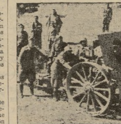
Un cañón, manejado por las hábiles manos de nuestros valerosos artilleros con precisión matemática dispersa las concentraciones enemigas