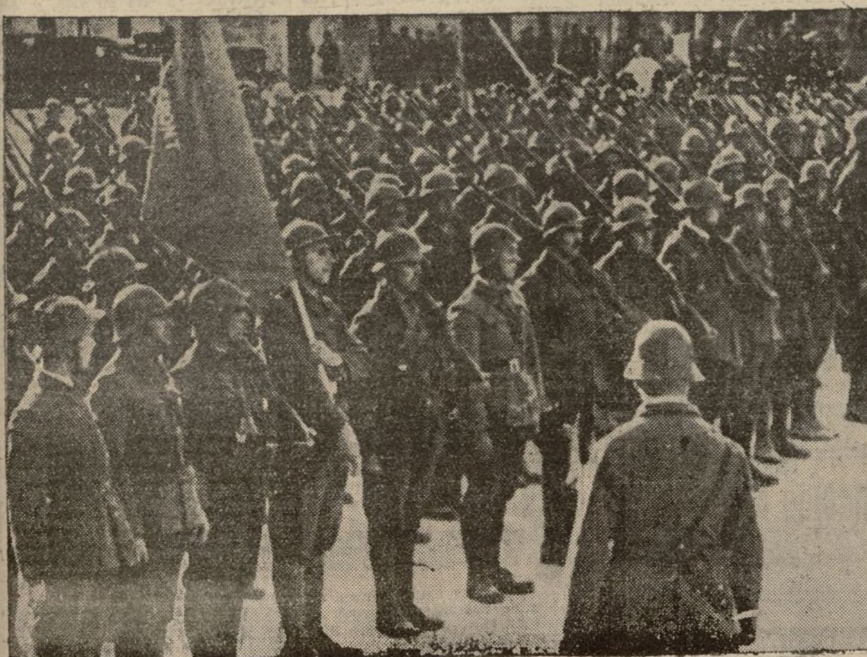
Las heroicas Brigadas Internacionales, que tan gloriosamente contribuyeron a la defensa de Madrid, y continúan luchando con gran entusiasmo por la causa de la República española.

tienen, como tales, de ayudar y colaborar en esta obra de depuración, a cuyo fin autoriza legalmente para que puedan proceder a la detención de todas aquellas personas que, como medios de propaganda, vayan repartiendo folletos, libelos, hojas, pasquines, etc., y demás impresos de carácter subversivo. Al mismo tiempo se advierte al público en general que serán detenidos todos los individuos que tengan en su poder alguno de los impresos de referencia. Los detenidos serán trasladados a la Comisaría de Policía más próxima a su domicilio.—Fehus.