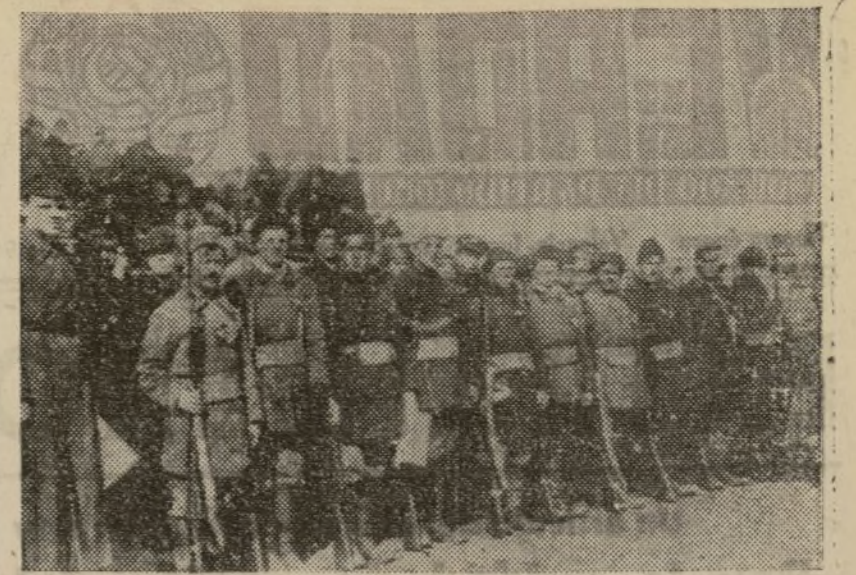
Cómo las masas populares cooperaron en la gran Revolución Socialista de octubre. Un regimiento de campesinos pobres.

Se ha dicho por algunos que el ganado sometido a un régimen de racionamiento produce más beneficios siempre que la explotación se haga en gran cantidad de cabezas (como si se tratara de una industria), separando la ganadería, por consiguiente, de la acción de la Naturaleza, como si esto fuese posible. Al ganado sometido a un ambiente artificial se le ocasionan trastornos, aunque la ración alimenticia que se le administra esté integrada por los elementos bioquímicos necesarios para el organismo. Podemos citar como ejemplo a las vacas estabuladas, que en su mayoría contraen un estado de debilidad orgánica que las hace más susceptibles a las enfermedades; este caso no se da, sin embargo, sino raras excepciones, en las sometidas a un régimen mixto de estabulación y pastoreo, como sucedía en Santander. Hoy la guerra, que impide el suficiente abastecimiento de pienso para el ganado, da lugar a un tanto por