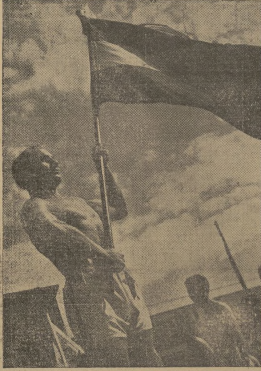
¡Arriba! ¡Cada día más alta la bandera de la unidad! ¡La bandera que defiende a España!

Tarragona.—En la Comandancia Militar han facilitado una nota en la que