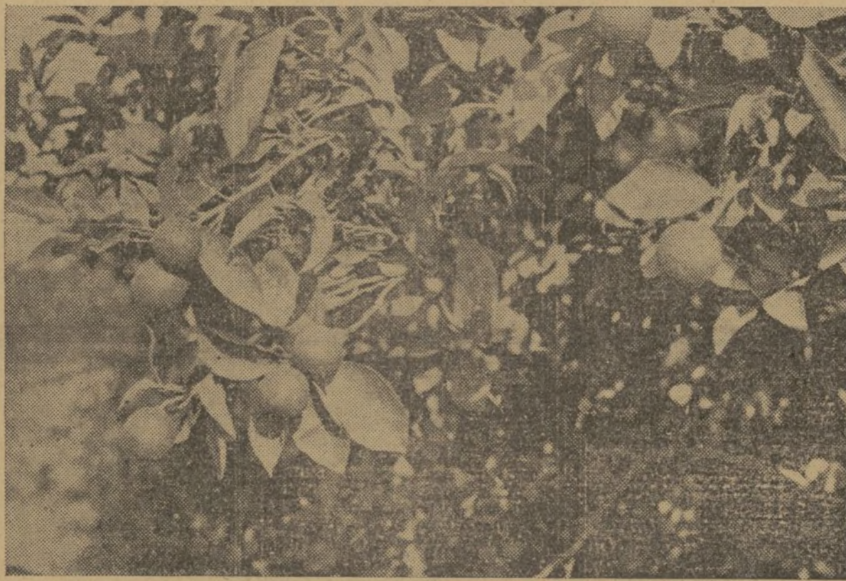
Naranjos valencianos. Fruto delicioso. Oro, divisas, prosperidad para nuestra economía.

Esta medida tiende a tomar en todo momento una reserva de viviendas para los casos de evacuación.—Fébus.