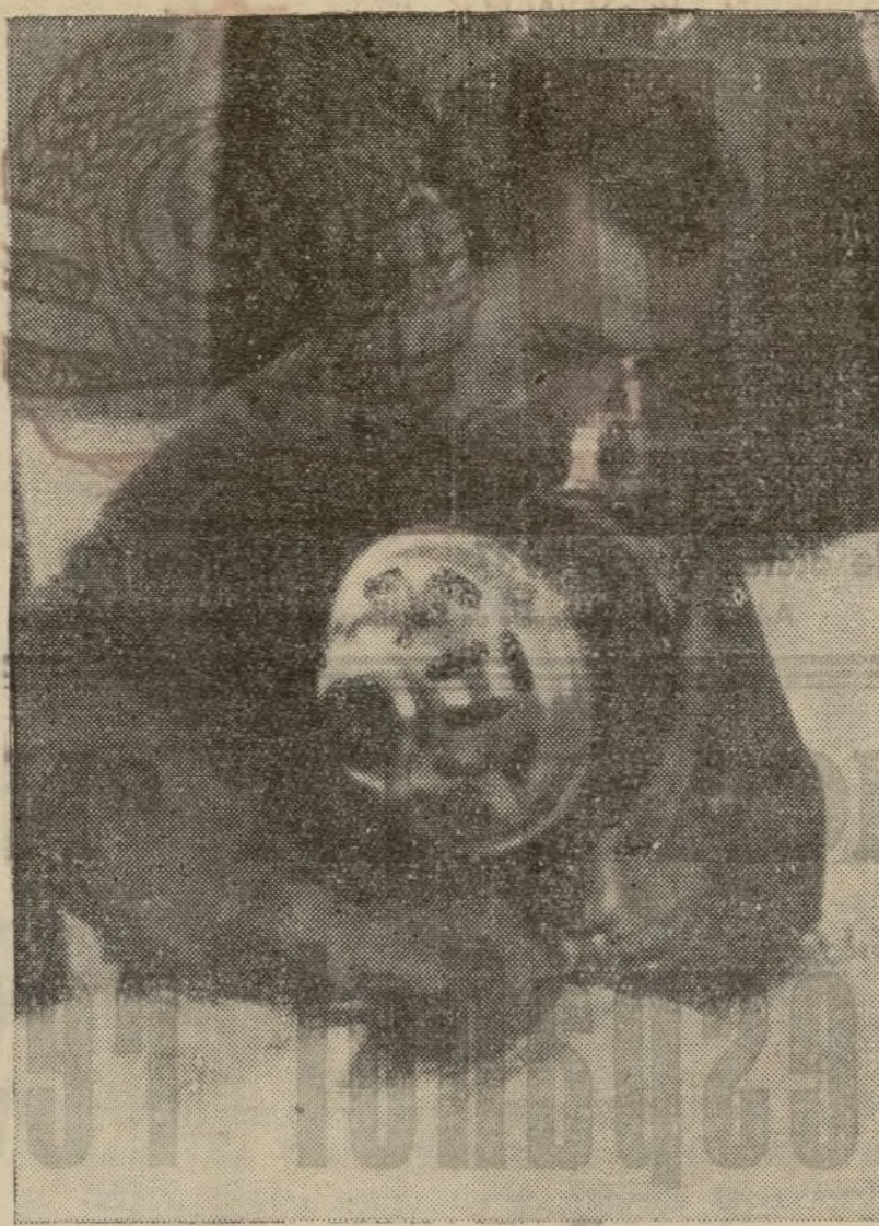
Hay que crear una moral de sacrificio con el trabajo constante en cada hora. Así lo comprenden todos los trabajadores que se esfuerzan en que su labor sea útil a los camaradas que luchan en las primeras líneas.