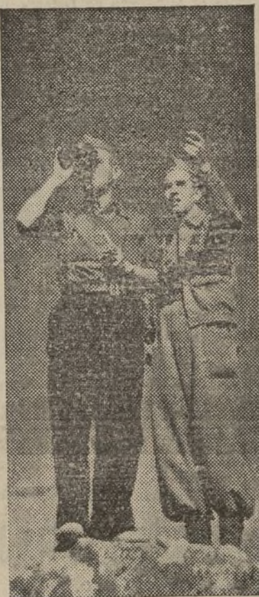
Un puesto de observación