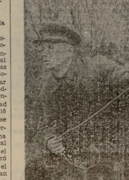
U. R. S. S. El komsojol Kowaltelonok, uno de los mejores soldados de los destacamentos de guardafronteras, tuvo el honor de asumir el servicio de guardia el día en que se celebró el XX aniversario de la Revolución.