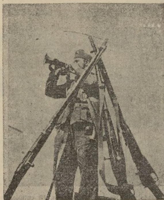
Frente de Teruel