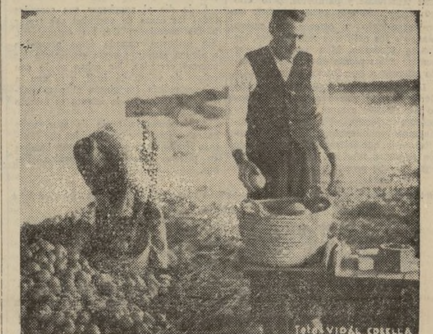
La naranja, seleccionada y pesada, está ya en disposición de ser transportada al extranjero.