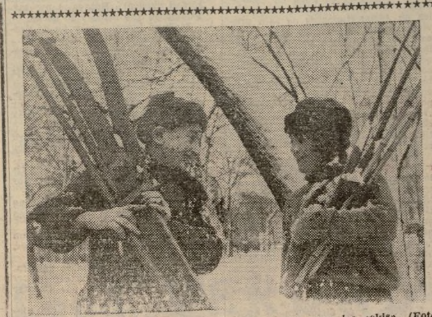
Los obreros de la fábrica de la U. R. S. S. en el momento de usar los esquís.

Por el Comité Provincial.—El Secretario sindical.