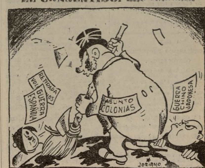
JOHN BULL.—Si no hubiese consentido este desorden no tendría que barrer... ¡Lo grave es que ahora no puedo barrer por haber consentido el desorden!