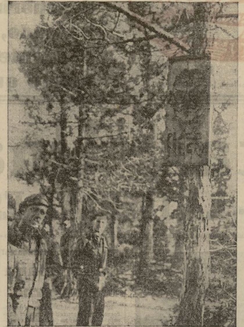
Como homenaje al Frente Popular, que une y resume todos los sectores antifascistas, los soldados han rotulado en las avanzadas, con el nombre del presidente del Consejo, una plaza campestre. (Foto Floet).