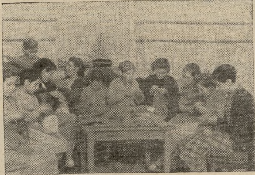
Con entusiasmo, con verdadero fervor, las manos hábiles de los jóvenes comisionados prendas de abrigo para nuestros heroicos soldados

La experiencia adquirida a través de dieciséis meses de guerra nos demuestra que la actuación de la "quinta columna" ha ido estrechamente ligada a la marcha de las operaciones militares, y que su acción criminal se ha recrudecido cuando el enemigo pasaba al ataque contra nuestras tropas. Por esto, ahora que el enemigo se prepara para lanzarse sobre nuestros frentes—cunco tenemos la seguridad de que nuestro Ejército no dejará de estar vigilante para aplastarlo con puño de hierro—, nosotros hemos de redoblar nuestras vigilancias en la retaguardia, intensificando la