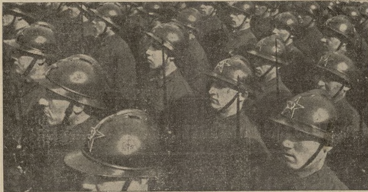
El más firme defensor de la democracia soviética, el Ejército Rojo de obreros y campesinos tiene derecho al voto, según establece la gran Constitución soviética