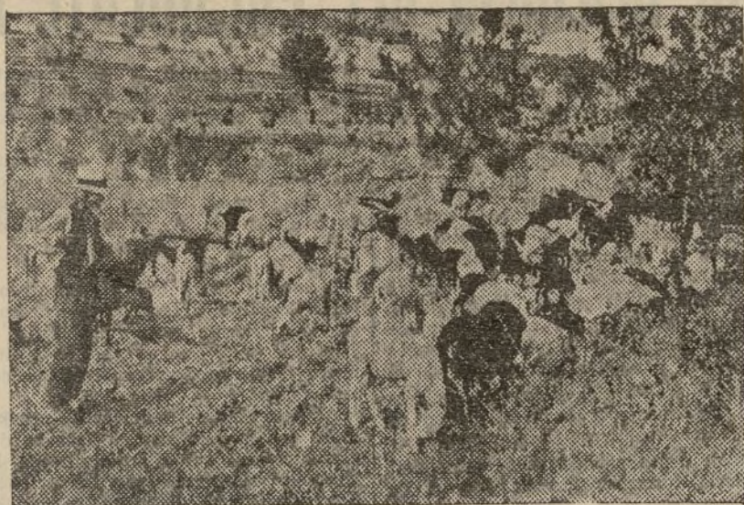
Gracias al trabajo de la Colectividad, se ha prestado en Ibi especial atención a la producción ganadera. Los obreros colectivistas, con una buena reserva de reses, han señalado una vez más el camino a seguir para organizar nuestra retaguardia activa