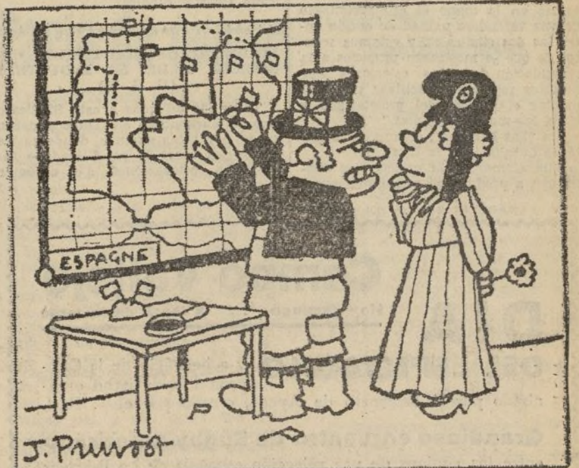
Marianne.—¿Marcas los puntos de guerra en España? John Bull.—No; señalo los mercados.

dad que significa cuanto hemos dicho más arriba—resistir hoy para atacar mañana—, y si entregamos todas nuestras energías a ponerlas en práctica, los próximos ataques, en los que el fascismo tiene puestas todas sus esperanzas, se convertirán, sin duda, en una derrota aplastante y decisiva, que jugará un papel de primera categoría en el porvenir de nuestro pueblo.