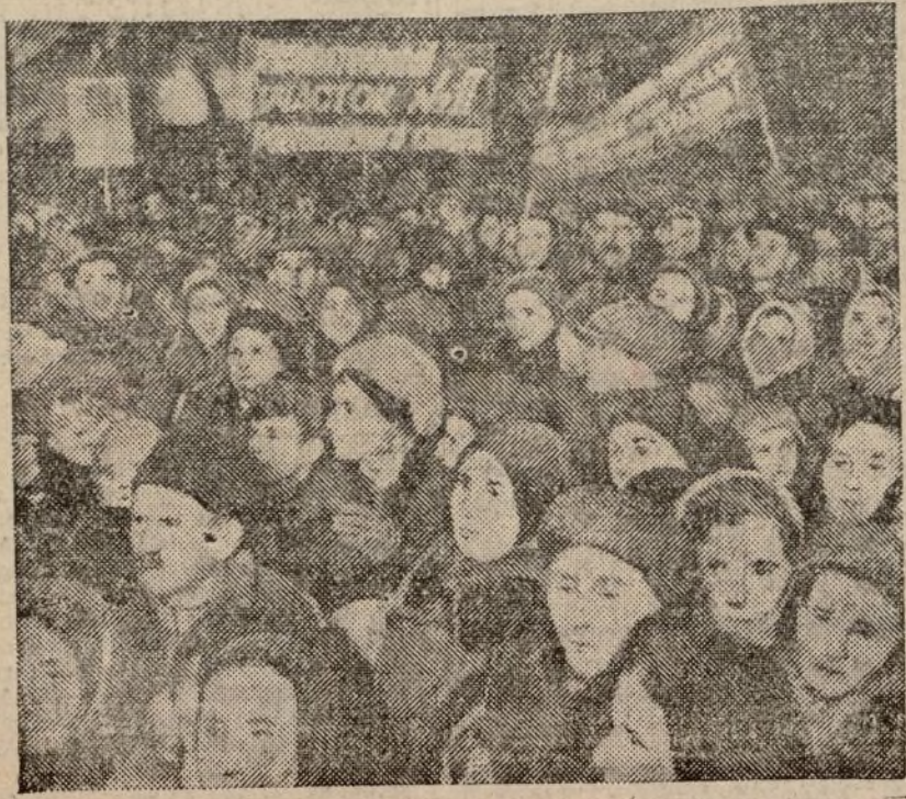
Un matín a los campesinos reducidos por la Revolución proletaria