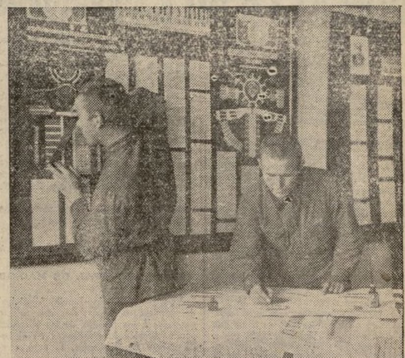
Los ciudadanos que sirven en las filas del Ejército Rojo gozan del derecho a elegir y de ser elegidos, igual que todos los ciudadanos. En la foto: los soldados rojos preparan el periódico mural consagrado a las elecciones para el distrito militar de su unidad