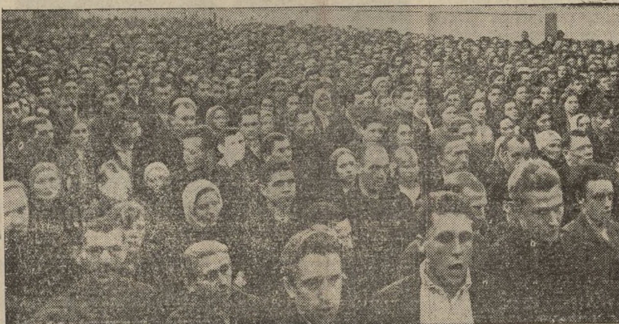
Los trabajadores acuden con entusiasmo, y en masas enormes escuchan la palabra de los candidatos al Soviet Supremo