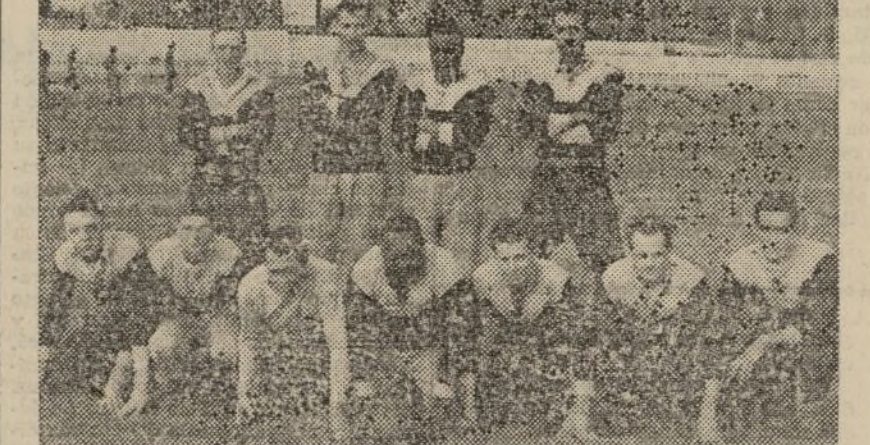
En el campo Vallejo, el domingo se jugó un partido de rugby a beneficio de la «Campaña de Invierno». He aquí los camaradas que componían uno de los equipos

pañía de guardias de la brigada de Blindados, 539; Comité Local del Socorro Rojo Internacional de Puig, 942,70; Comisión recaudadora del regimiento de Infantería número 10, 3.674,40; obreros de la fábrica de alcohol de Bugarra, 500; funcionarios de la Aduana de Valencia (un día de