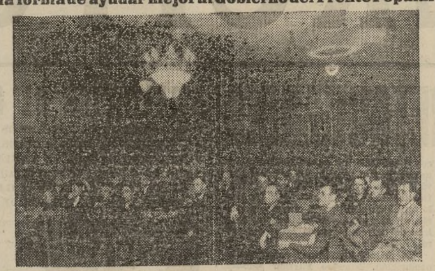
Un aspecto del salón donde se celebran las sesiones del Congreso extraordinario de la Federación Tabaquera (U. G. T.)

En ellas se estudian los problemas de los trabajadores y la forma de ayudar mejor al Gobierno del Frente Popular