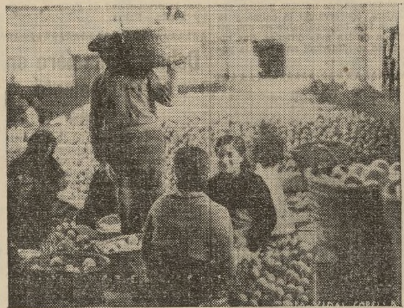
Con nuestro esfuerzo organizado en el campo ganaremos la batalla de la producción y abasteceremos los frentes y la retaguardia activa, así como reforzaremos los lazos de solidaridad internacional.

Campaña naranjera. El pasado año se erró en algunos puntos. Esta temporada las Cooperativas, controlada la exportación por el Gobierno, están llamadas a desarrollar una magnífica