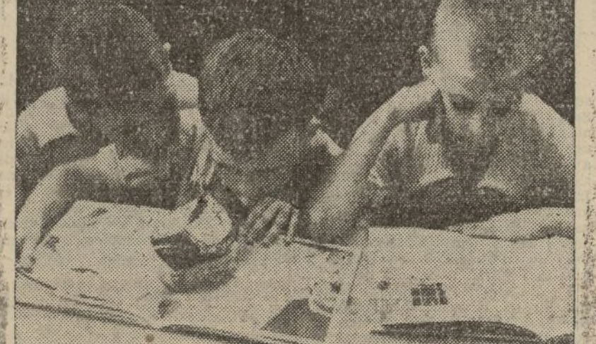
El Gobierno del Frente Popular les dedica todo su cariño y cuidado.

Expresó el deseo de que a la próxima Asamblea acudan los trabajadores con un solo carnet.