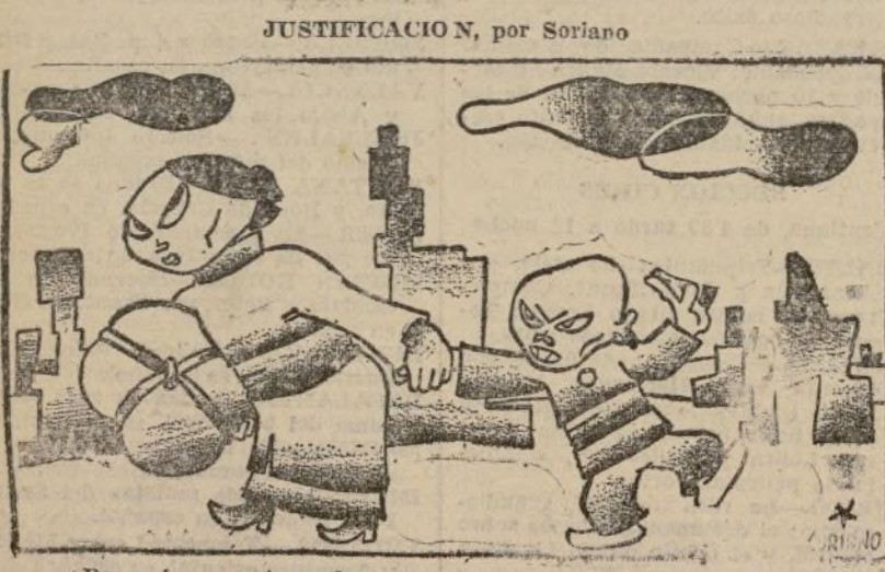
—Por qué nos matan a los amarillos? —¡Mílo! ¡porque somos rojos!