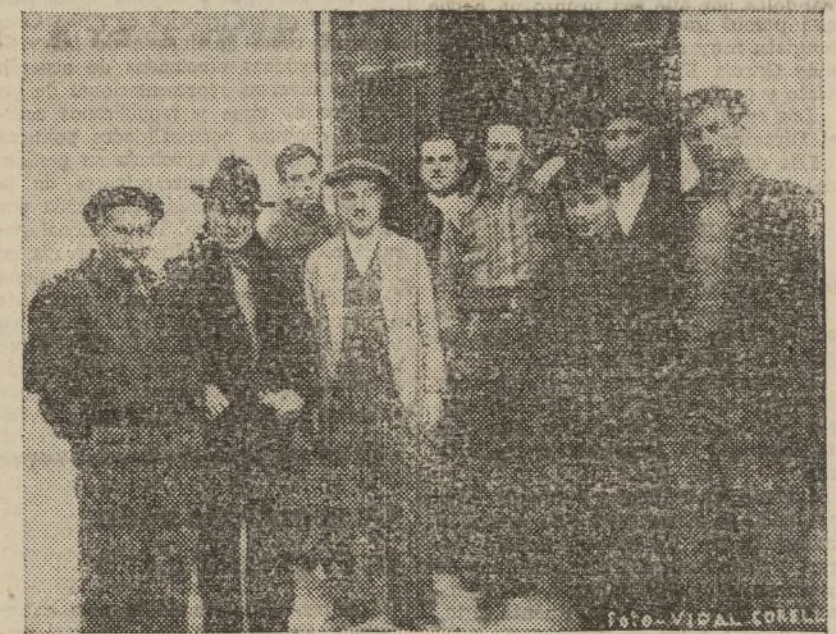
Los cooperativistas de Gandia están en estrecho contacto con su comarca, Varios de ellos, a la puerta de su Sociedad.

Los antecedentes de este asunto son los siguientes: El 24 de septiembre, la Consejería contrató con Mata la compra de una partida de dos millones de kilos de garbanzos, otros dos millones de kilos de judías, ocho mil cajas de huevos, un millón de kilos de bacalao y cuatro mil barriles de ararques, todo lo cual importaba 16.400.000 francos, que debían ser cobrados