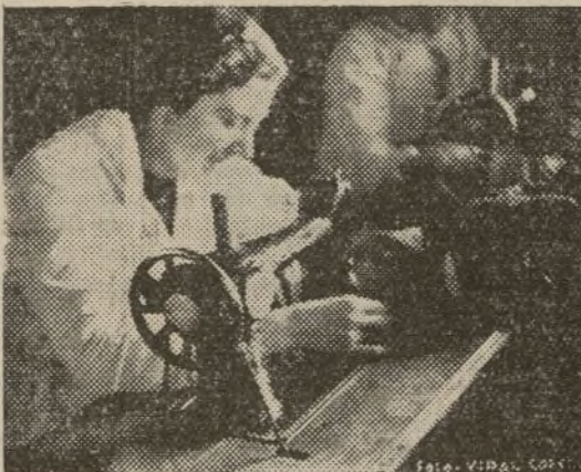
Más camisas, más bufandas, más mantas para nuestros soldados. Ni un brazo inactivo en la retaguardia.

—No todas somos de Monserrat. Aquella joven, por ejemplo, es de Madrid. Ha pasado en su pueblo los más crueles bombardeos, ha visto caer incendiadas muchas casas, morir muchos niños. Ha conocido los horrores de la invasión. Si vieras con qué ahínco, con qué entusiasmo trabaja. Lo hace por su Madrid. Para que la fiebre