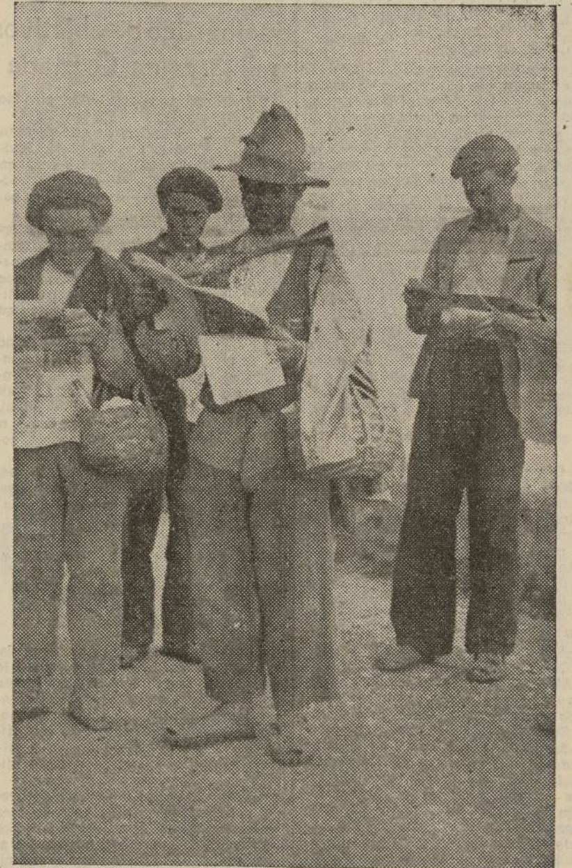
La República democrática lleva la cultura al campo español en cruzada contra el analfabetismo, fruto de un régimen ya derrocado.