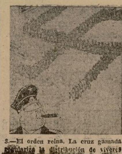
3.—El orden reina. La cruz gamada regulariza la distribución de víveres

Castellón.—A las seis de ayer mañana dos hidroaviones se han presentado sobre Alcocebre, arrojando tres bombas en el pueblo. A las seis y dos minutos evolucionaron por los alrededores de Cabanes, dejando caer varias bombas, algunas de ellas incendiarias, que ocasionaron pequeños incendios en las inmediaciones del poblado. Después ametrallaron la carretera, ocasionando algunos heridos. Rápidamente la brigada de bomberos de Castellón, logró sofocar los incendios ocasionados por las bombas incendiarias.—Febus.