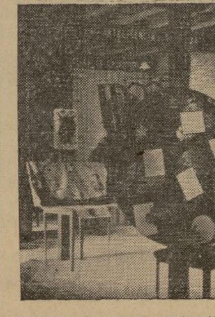
Capacitación de los mandos, instrucción cultural de los soldados. Armas para los combates futuros. He aquí una vista de la exposición de periódicos murales y carteles de propaganda organizada por el primer cuerpo de Ejército. (Foto Mayo).

Apareció la nueva edición de ATLAS DE ESPAÑA Y NOMENCLATOR. Registra TODOS los pueblos de España. En él encontrarán la situación del pueblo que le interese. Precio del ejemplar: DIEZ PSETAS. De venta en buenas librerías. Pedidos a Antonio Álvarez Rubio, oficial de Correos, Valencia. Se remite a todas partes contra reembolso, menos a los frentes, para donde no hay ese servicio.