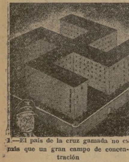
1.—El país de la cruz gamada no es más que un gran campo de concentración