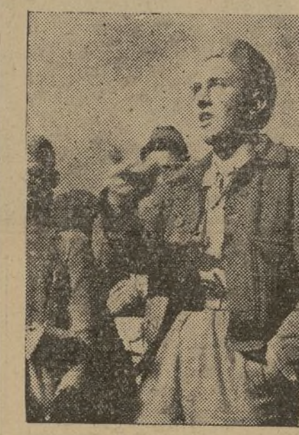
"Queremos la unidad en la retaguardia; nosotros la hemos hecho ya en los frentes", dice este combatiente anónimo, salido de las trincheras de El Pardo.

los cuarteles de los edificios, a muchos metros de profundidad. Existen ya estas trincheras. Unas y otras se confunden, se entrelazan, formando una ciudad, casi subterránea.