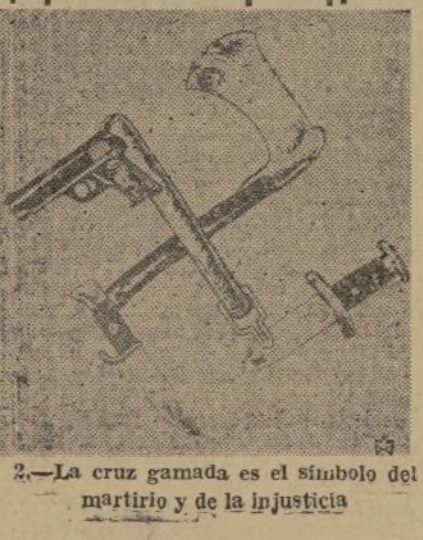
2.—La cruz gamada es el símbolo del martirio y de la injusticia