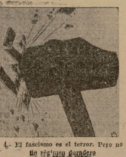
4.—El fascismo es el terror. Pero no un régimen duradero