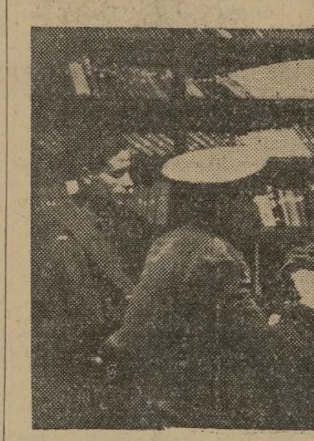
Soldados distraen sus horas de ocio en los Hogares del Combatiente, que existen en todos los batallones, brigadas, divisiones y cuerpos de Ejército.

Existen tres consignas que se repiten en los periódicos murales de todos los batallones de la Brigada. Y que van desde la Brigada a las que defienden los cuarteles de los edificios, a muchos metros de profundidad. Existen ya estas trincheras. Unas y otras se confunden, se entrelazan, formando una ciudad, casi subterránea. La guerra ya no es la de entonces. En el Comisariado, el periódico mural tiene tres consignas que lo explican mejor: "Fortificación, capacitación, vigilancia". Son tres consignas que se repiten en los periódicos murales de todos los batallones de la Brigada. Y que van desde la Brigada a las que defienden los cuarteles de los edificios, a muchos metros de profundidad.