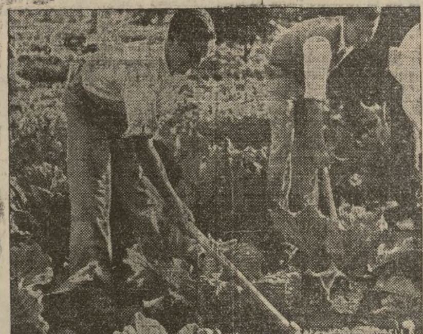
En la Granja Escuela de Capatnees los jóvenes campesinos trabajan con entusiasmo y perfeccionan la técnica agrícola.