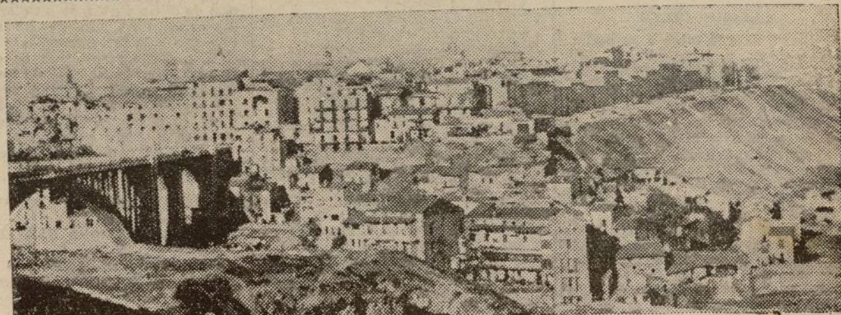
Teruel, la vieja ciudad, reconquistada por nuestras fuerzas para la República

(VEASE LA INFORMACION EN LA CUARTA PAGINA)