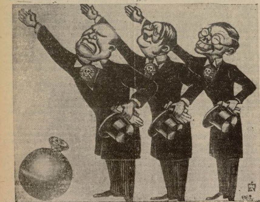
—Esta es la primera pista para nuestra Sociedad de Naciones.

Amenizó el acto la Banda de la 42 Brigada.—Fébus.