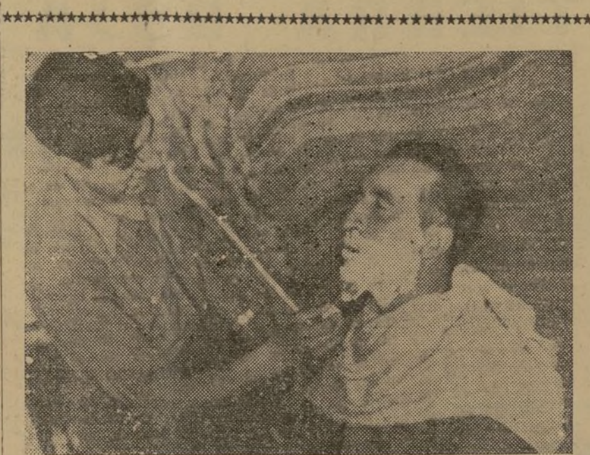
En el frente, durante un alto en la lucha, el barbero hace el afeitado del soldado combatiente.

Teruel es el primer paso; un paso de gigante, ciertamente, hacia la victoria; esa victoria que será por entero del pueblo español, porque es soberano en su fervor indomable y porque en su fe patriótica, sinceramente patriótica, ha sido capaz hasta de convertirse en organizador, como han de ser los organizadores, callados, sufridos y esforzados.—Fébus.