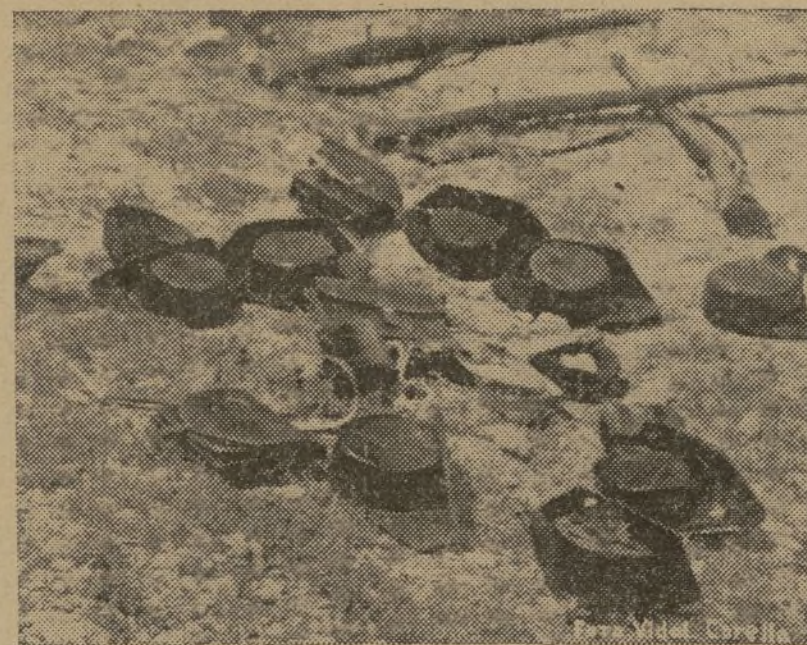
El mismo espíritu medieval—de opresión y tiranía—que bulla en los retráidos cerebros que se cobijan bajo estos triclinos, abandonados en la vergüenza de una fuga, es el que latía entre los muros del Seminario de Teruel